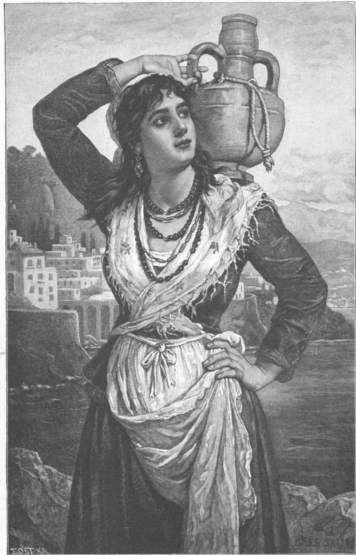
ΚΟΡΗ ΥΔΡΟΦΟΡΟΣ ΕΝ ΑΜΑΛΦΗ. (Εἰκὼν Ἰουλίου Σάλλης.)

μῶδες ἄσμα τῆς ὠραίας Ῥοζέλλας, τῆς «μαγίσσης τῆς Ἀμάλφης», ἣτις ἀπῆλθε τῆς πατρίδος τῆς, ἵνα ὡς ῥόδον μαρανθῆν προῶως ἀποθάνῃ δυστυχῆς καὶ ἐγκαταλειμμένη. (Ὅρα περὶ τοῦ ἐπεισοδίου τούτου τὸ δημῶδες ποίημα La fata di Amalfi ἐν τῇ Συλλογῇ τῶν δημῶδων τῆς Νεαπόλεως ἑσμάτων.)