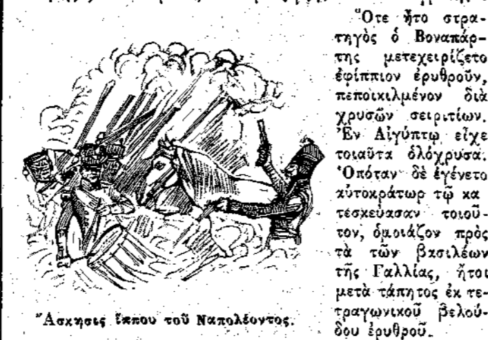
Άσκησις ίππου του Ναπολέοντος.

χροα. Τούς ήγάπα δε πολύ και έπεφόρτισε μάλιστα τον διάσημον ζωγράφον Όράτιον Βερνέ ν' απεικονίση τινάς εξ αύτων δι' ύδατοχρωιάς. Οί διασημότεροι των ίππων, ού; ο Μέγας Ναπολέων ίππευσεν, ήσαν ή «Στυρία», ο «Δειλός», ο «Κατακτητής», ο «Σολιμάν», ο «Αρταξέρξης» και ο «Ευφράτης».