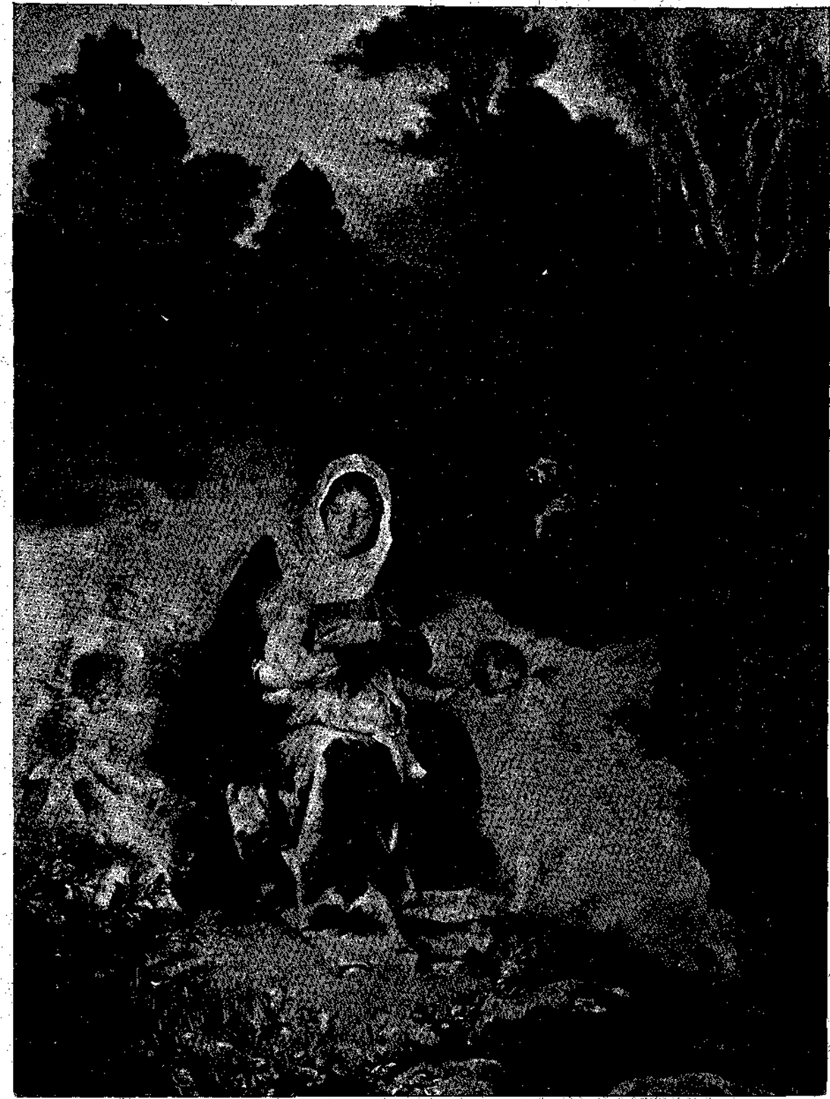
Στιγμαὶ ψυχικῆς ἀγαλλιάσεως

— Ἄν θέλῃ ὁ Θεός. Καὶ κατήλθομεν. Τὴν νύκτα δὴν διήλθομεν οὕτω καὶ τὴν ἑπαύριον περὶ τῶν 10 ὥραν ἀφίχθημεν εἰς Πύργον, οὕτινος μετ' εὐχαριστήσεως εἶδον μετὰ ἐνός ἔτους ἀπουσίαν, ὅτι ὁ λιμὴν, δὲ