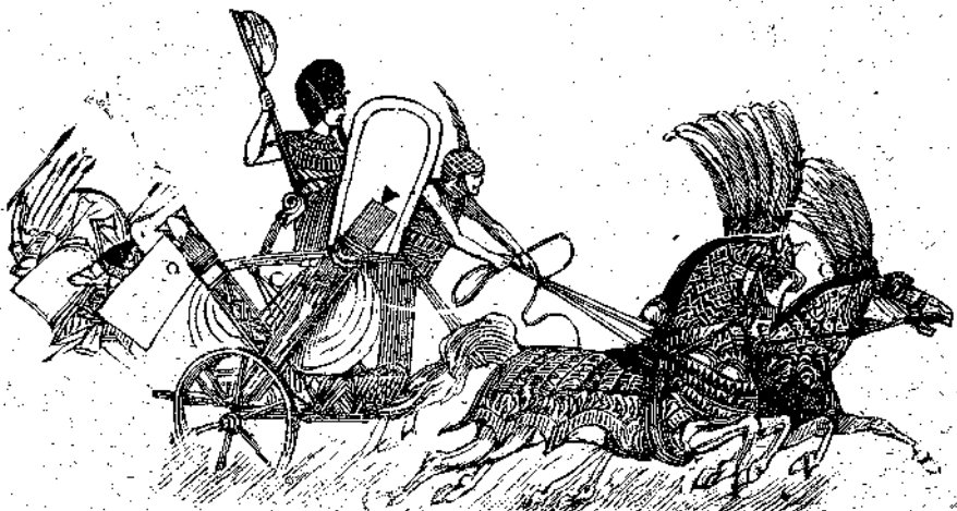
Τὸ ἄρμα τοῦ Φαραῶ

Οἱ ἀρχαῖοι Ἕλληνας ἀνιήγειρον πολλοὺς ἀνδριάντας τοῖς ἵπποις αὐτῶν, ἰδίως δὲ τοῖς ἀμειβομένοις διὰ βραβείων ἐν τοῖς δημοσίοις ἀγῶσι, ἐν δὲ τῇ Ὀλυμπίᾳ ὑπῆρχεν ὁ τῆς φορβάδος Αὔρας, ἕνεκα τῆς μεγάλης αὐτῆς ὠμότητος. Ὅτε ἡμέραν τινα αὕτη ἐτρέχεν ἐν τῷ σταδίῳ κατέπεσεν ὁ ἐπιβαίνων αὐτῆς Φιλώτας, αὕτη ὁμοῦς ἐξηκολούθησε τὴν πορείαν τῆς, δι-