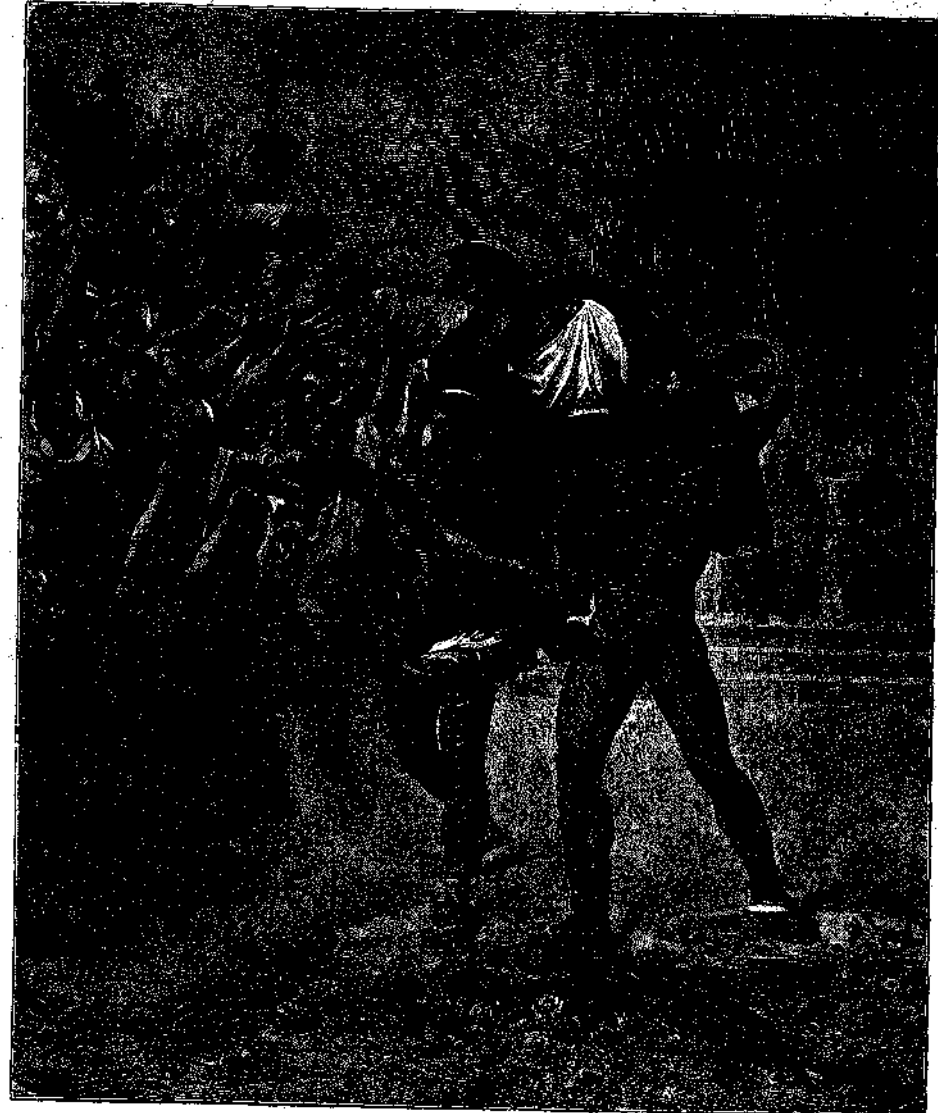
Ο θρήνηθος του Διαγόρα

προς και διακινημένη, έλαμον εις τήν ψυχήν καρδί του Κυρίου ζωπράν ένταπασιν. — Σεις δέν φαίνοσθε τῷ ειπε νά εγεννήθητε διά νά έπτήτε έλεημοσύνην. Τι εις τούτο σά κινεί; — "Αχ! εγώ δέν εγεννήθην βεβαίως, άπεκρίθη ο νεανίσκος, μετά στεναγμού συλοζευόμενου υπό θαυρών, εις τόσον άθλιαν κατάσταση. Αί άτυχία του πατρός μου και ή δυσχερής θέσις, εις έν