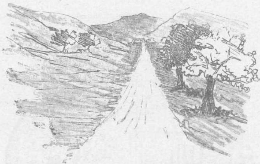
Ἡ ΜΕΓΑΛῆ ΕΥΘΕΙΑ : Μαραθῶνιος δρόμος