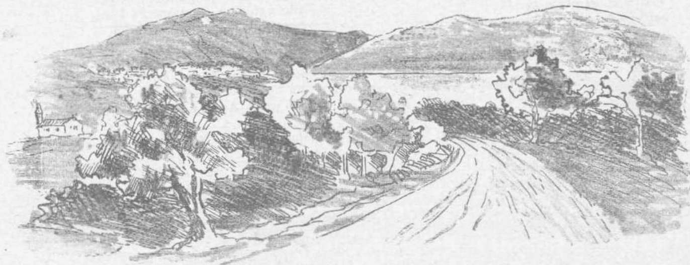
ΑΠΟΨΙΣ ΜΑΡΑΘΩΝΙΟΥ ΠΕΔΙΟΥ : Μαραθῶνιος δρόμος

Συμπίπτει δ' ἡ τῶν Ὀλυμπιακῶν ἀ- γῶνων ἀκμὴ σχεδὸν τῇ ἀκμῇ τῶν Ἑλλη- νικῶν πολιτειῶν, τῶν πλείστων τοῦλά- χιστον, ἦτοι ἀπὸ 548—429 π. χ. διότι κατὰ τὸ δικάστημα τοῦτο ἠγωνίσθησαν οἱ ρωμαλεώτατοι τῶν ἀγωνιστῶν καὶ ἀνε- δείχθησαν οἱ ἀριστοὶ Ὀλυμπιονῆται. Τότε ἤμασαν οἱ πειρήματα Κροτωνιάται ἀ- θληταί, ὁ Μίλων, ὁ Ἰσχυράχος, ὁ Τισι- κράτης, ὁ Ἀστυλος καὶ ἄλλοι. Ἀλλὰ πάντας τούτους ὑπερέβη ὁ Μίλων ὁ Διο- τίμου, ὅστις ἐπτάκις ἐνίκησεν, ὡς μαρ- τυρεῖ ἐπιγράμμα τι ἐπὶ τοῦ ἀνδριάντος αὐτοῦ ἐγκεχαρῆμένον, ἔχον ὄψει: