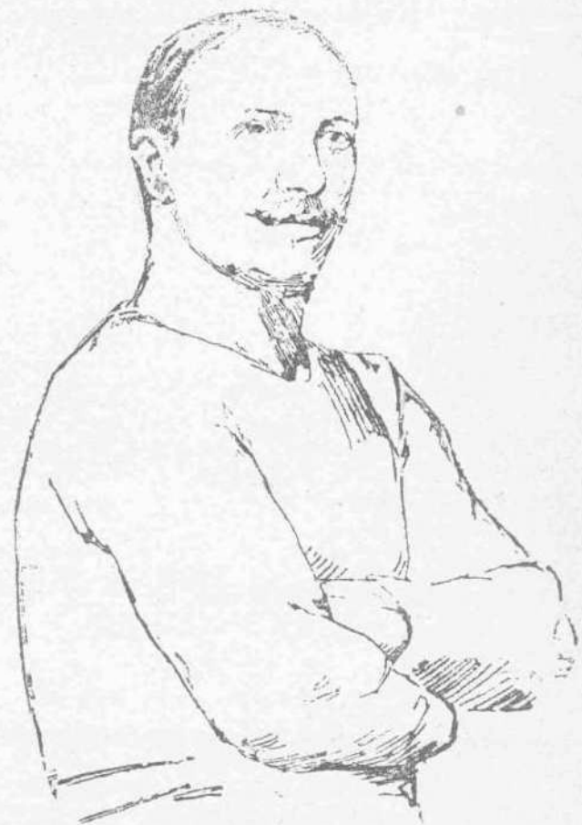
ΣΟΥΤΤΕΡ (Νικητής του ίππικού έραλτηρίου—Έλβετία)