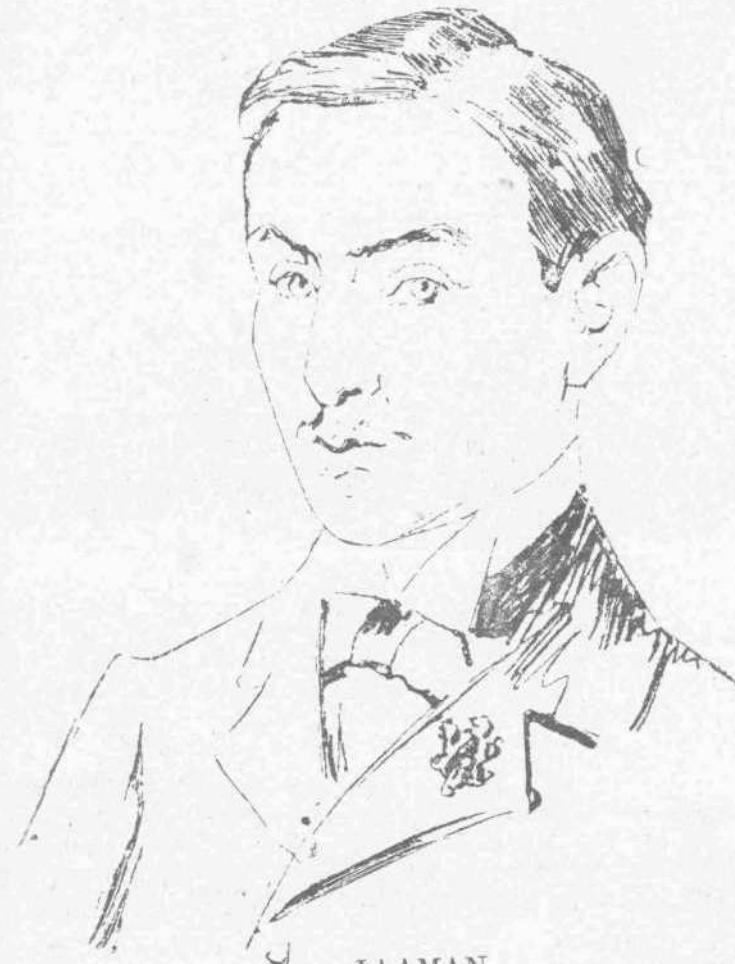
ΦΛΑΜΜΑΝ (Νικητής του άγώνος των 100 χιλιομέτρων—Γαλλία)