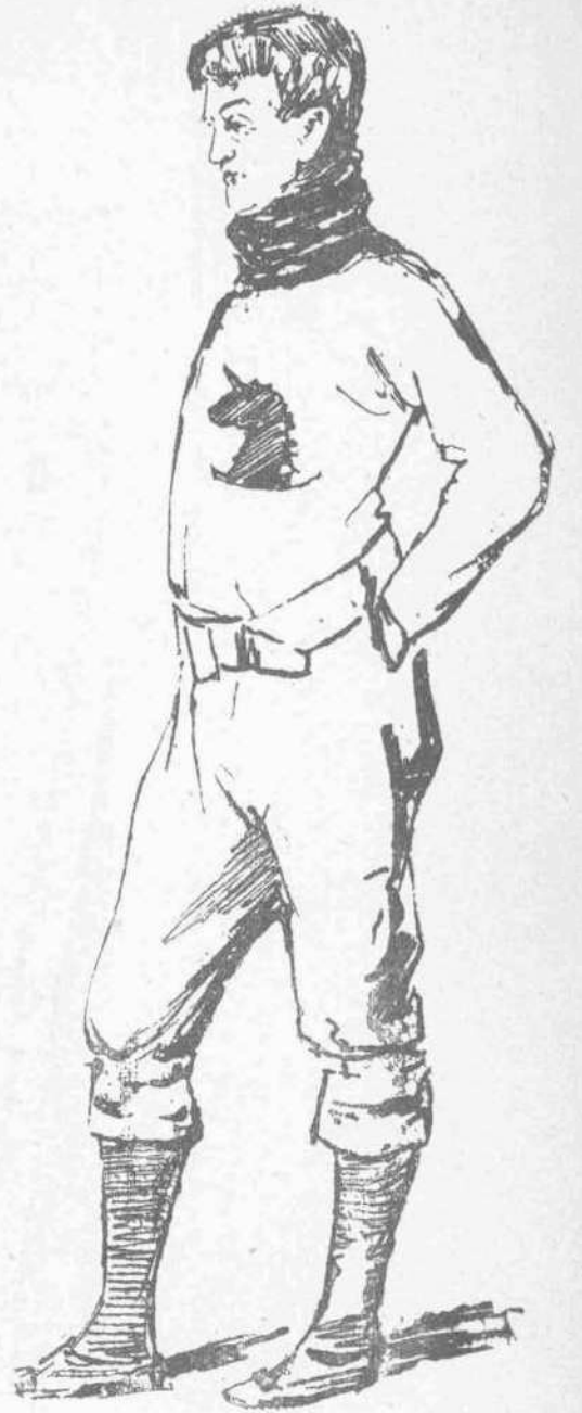
ΒΟΥΡΚΕ (Νικητής εις τὸν δρόμον τῶν 100 καὶ τῶν 400 μ. — Αμερική)