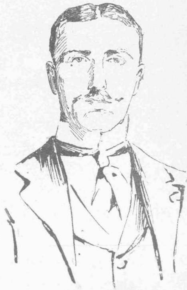
ΓΚΑΡΕΤ (Νικητής του δίσκου—Άμερικη)