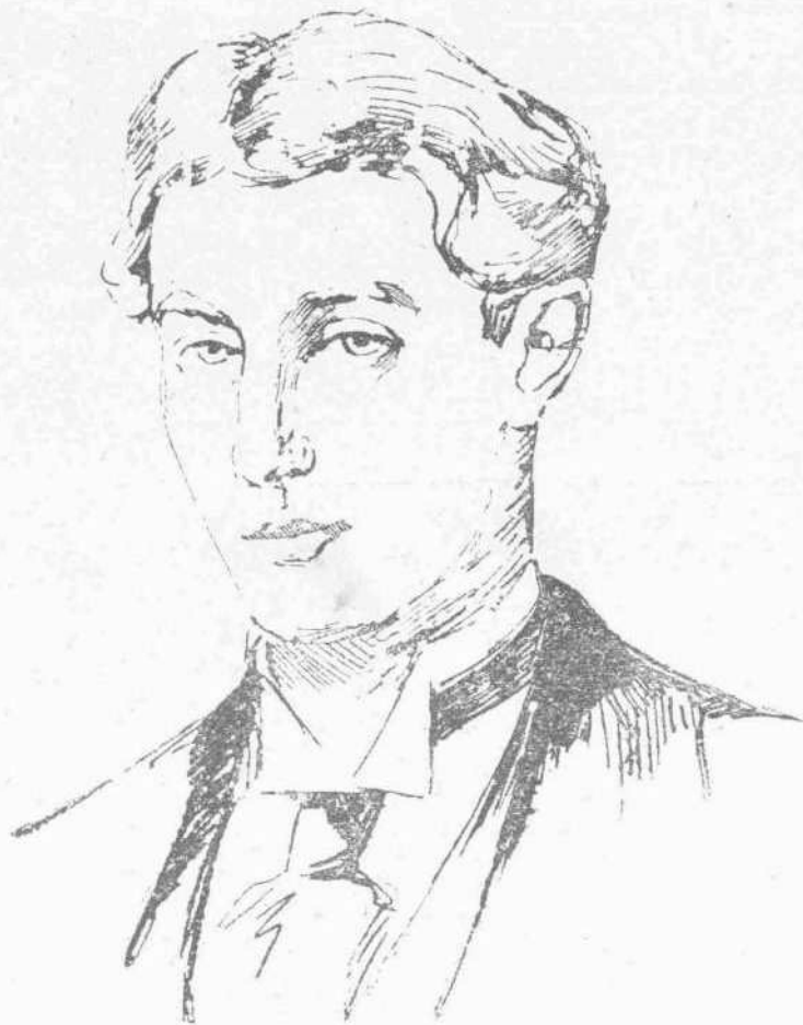
ΧΟΥΤ (Νικητής του άλματος επί κοντώ—Άμερικη)