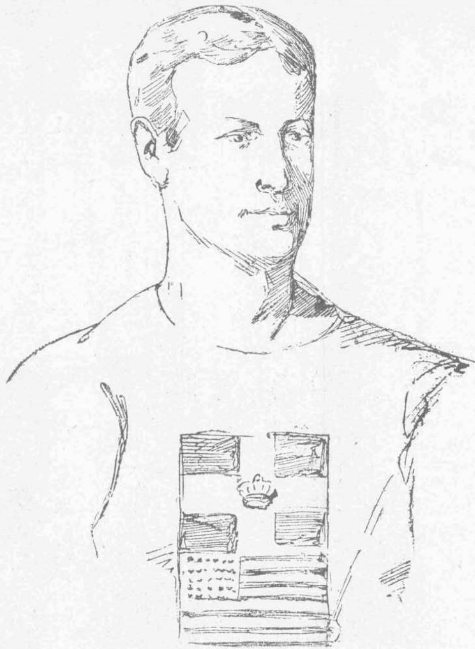
ΚΟΥΡΤΙΣ (Νικητής του δρόμου των 110 μ. — Αμερική)