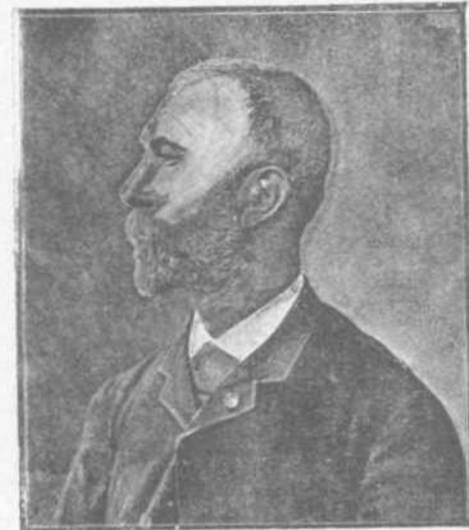
Κ. ΚΑΡΑΪΑΝΟΣ Βουλευτὴς Ἄρτας