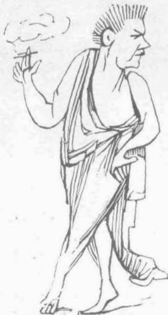
(Συνέχεια καὶ συμπ. τέλος).