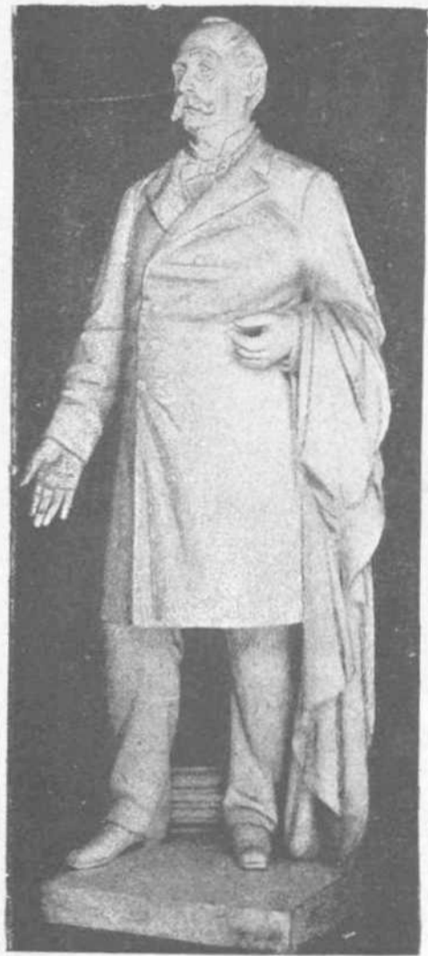
ΤΟ ΠΡΟΠΛΑΣΜΑ ΤΟΥ ΑΝΔΡΙΑΝΤΟΣ ΤΟΥ Κου Γ. ΑΒΕΡΩΦ

Κατὰ τοὺς χρόνους ἐκείνους δὲν ὑπῆρχε μὲν συστηματικὸς προϋπολογισμὸς ἐν τῇ ἐνοίᾳ ἀπαντᾶ οὗτος σήμερον εἰς ὅσα ἰδίᾳ κράτη ἰσχύει τὸ ἀντιπροσωπικὸν σύστημα, ἐν τῇ πράξει ὅμως τῆς τότε οικονομίας ἰσχυρᾶται τελεία τάξις ἦσαν καθωρισμένα τινεὶ δαπάναι ἐπρεπε νὰ καλυφθῶσι ὑπὸ ἐπίσημῃ καθοριζομένων προσώδων. Τὰ δικητικὰ ἐξόδα φ. ε. ἐκκλύπτοντο ἐκ τῶν τότε ἐκ τελῶν εἰσπράξεων, τὰ δὲ τὴν ἀπονεμὴν τῆς δικαιοσύνης ἐξόδα ἐκ τῶν προστίμων καὶ προκαταβολῶν, ἀπὸ δὲ τὰ περισσεύοντα χρήματα ἐκάστου πάρου, συναποτελεῖτο ἡ δημοσία θησαυρός, ὅστις κυρίως ἐχρησίμευε διὰ τὰς ἐκτάκτους πολεμικὰς δαπάνας, πολλὰς δὲ, ἀποτρεπόμενος τοῦ ἀρχαίου αὐτοῦ σκοποῦ, διετίθετο εἰς θεωρικά καὶ ἄλλα ἡμέρας φρεσῶς δαπανήματα. Φαίνεται δὲ ὅτι αἱ ἐν τῇ νεωτέρᾳ ἑλληνικῇ Πολιτείᾳ κρατήσασαι ἰδέαι περί σὺν ἰσοζυγίου, ὅτι ἐκληρονομήθησαν ἐκ τῶν Ἀθηναίων ἡμῶν προγόνων. Διότι καὶ οἱ πρόγονοι ἡμῶν ἐν ᾧ εἶχον πραγματικὸν περίσσευμα τακτικῶν ἐσόδων, ἐν σχέσει πρὸς τὰ τακτικὰ ἐξόδα, ἐν τούτοις ἐνεκα τῶν πολ- λῶν καὶ ποικίλων ἐκτάκτων δαπανῶν ἢ πάλαι τῶν Ἀθηναίων πολιτεία θὰ περιήρχετο ταχέως εἰς πτώχευσιν ἐὰν μὴ συνεκράτει αὐτὴν ἢ μέχρι ἀσπλαγχνίας χωρῆσα δὲ εἰσφορᾶς τῶν συμμάχων φορο- λογία καὶ ἢ μέχρι ἀποστραγγίσεως γιγνο- μένης, ὑπὸ τύπον δανείου συνήθως, ἐκμύθη- σαι τῶν ἐν ταῖς ναεῖς θησαυρῶν οὐκ ὀλί- γον εἰς τὴν συγκράτησιν συντείνουσαι καὶ