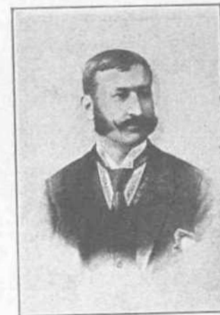
Α. ΣΚΟΤΖΕΣ Υπουργὸς τῶν Ἐξωτερικῶν