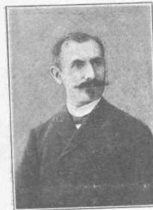
Θ. ΠΕΤΣΙΝΑΣ Πρόεδρος Δήμου Πειραιῶς