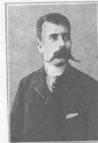
Α. ΖΑΓΜΗΣ Πρόεδρος τῆς Βουλῆς