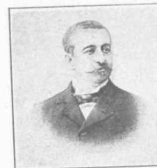
Κ. ΜΑΥΡΟΜΙΧΑΛΗΣ Υπουργὸς τῶν Ἐσωτερικῶν

ΤΑ ΜΕΛΗ ΤΗΣ ΕΠΙΤΡΟΠΕΙΑΣ ΤΩΝ ΟΛΥΜΠΙΑΚΩΝ ΑΓΩΝΩΝ