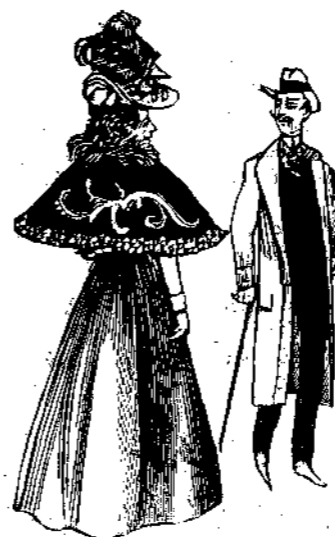
ΣΥΝΑΝΤΗΣΙΣ ΜΕΤΑ 10 ΕΤΗ

— Νά, γιὰ δὲς ἐκεῖνο τὸ σύννεφο, τί εἶναι ; — Τί εἶναι ; νὰ καπνός. — Ἄ ! καπνός, . . . ποῖός τὸν ἔκανε ; — Ποῖός τὸν ἔκανε ; νὰ ὁ Θεός — Ἄ ! ὁ Θεός . . . Αἱ . . . νὰ καὶ ἐγὼ κάνω σύννεφο μετὰ τὸ τσιγάρο μου. Νὰ γιὰ κύτταξε . . . τὸ καπνὸ τοῦ τσιγάρου μου. — Αἱ ! καὶ με τοῦτο τί ; εἶσαι καὶ σὺ ὁ Θεός ; ρέ μπεκρούλιακα . . .