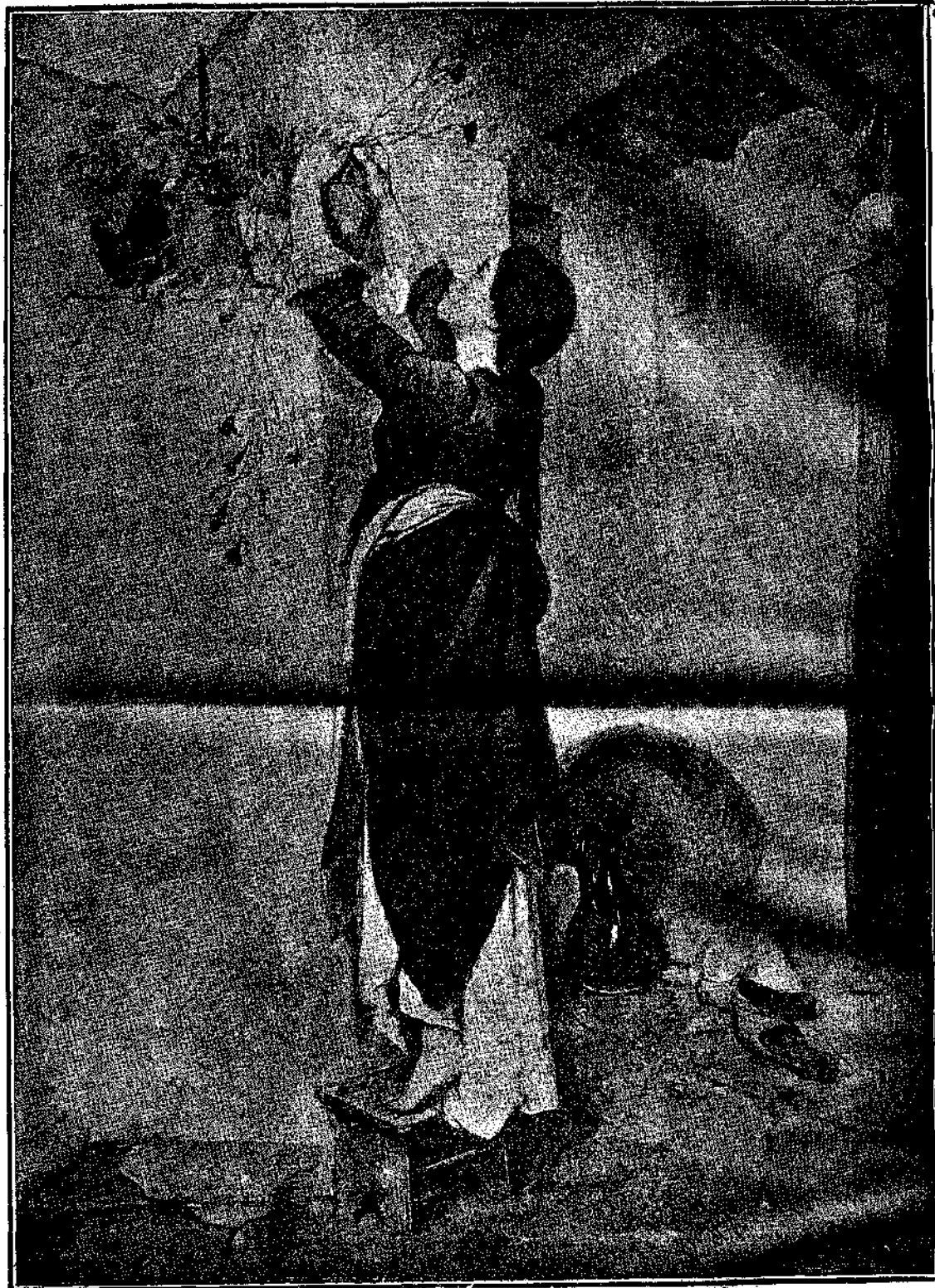
ΠΡΟΕΤΟΙΜΑΣΙΑ ΝΕΟΥ ΕΤΟΥΣ