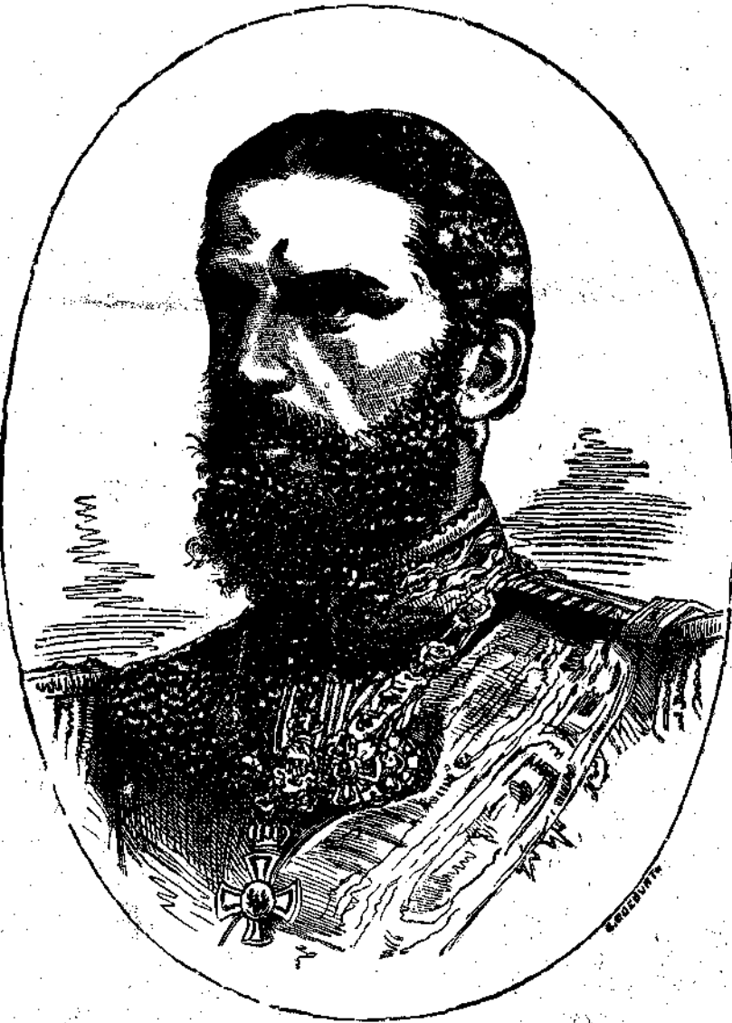
Ο ΒΑΣΙΛΕΥΣ ΚΑΡΟΛΟΣ ΤΗΣ ΡΩΜΟΝΙΑΣ