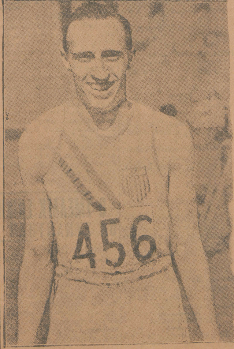
Ο ύπεροχος έμποδιστής Μπάρν. —Θριαμβεύει εις τους δρόμους έμποδίων εις τό τουρνέ των 'Αμερικανών εις την Ευρώπην

'Ηστμαν (Η.Μ.) 1' 53" 2)5, 2) Πετίτ (Γαλ.) 1' 55" 2)5, 3) Κέλερ (Γαλ.) 1' 55" 2)5. 'Ο Μπέν 'Ηστμαν, ό πιο ταχύς άνθρωπος» έτρεξε χω