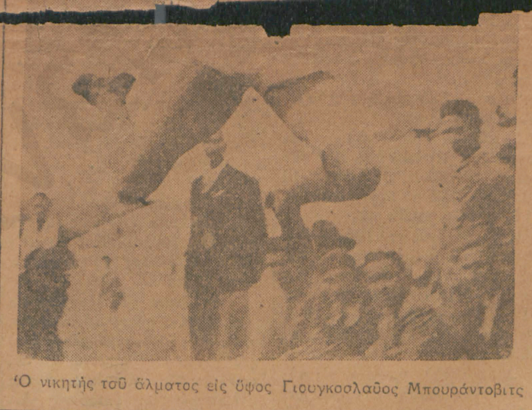
Ο νικητής του άλματος εις ύψος Γιουγκοσλαβος Μπουράντοβιτς