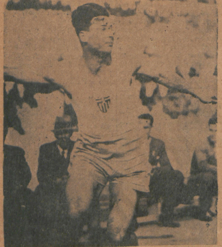
Ο καταρτίφας το Βαλκανικόν ρεκόρ της διακοβουλίας "Ελλην άθλητης Σύλλας

Ελληνικά χρώματα — μαζών του πυροπολυμένου από ένθουσασμών και ιερών συγκινήσεων Ελληνικού λαού του κατακλύβοντος κατά μυριάδας το Παναθηναϊκόν Στάδιον, έπέτυχαν και πάλιν θριαμβευτικάς νίκας και τρόπαια άνυπολογίστου σημασίας, Ο 'Ελληνας άθλητικός έδωκεν αίσθησιν και πάλιν χθές επί της άγαμφοβητήτου δυναμικότητος του άγαθάς έλπίδας και προσδοκίας του 'Ελληνικού λαού. Το 'Ελληνικόν 'Εθνικόν Σύμβολον το ένθυμίζον τούς έφρονές και τα κύματα των γαλανών Ελληνικών θαλασσών επανειλημμένως ύψώθη επί του Ιστού του Σταδίου του Ζάγκρεμπ και επανειλημμένως ή δοξασιική ύψη των ελληνικών τροπαίων ίαχθη δόνησεν την άπισσασίαν του