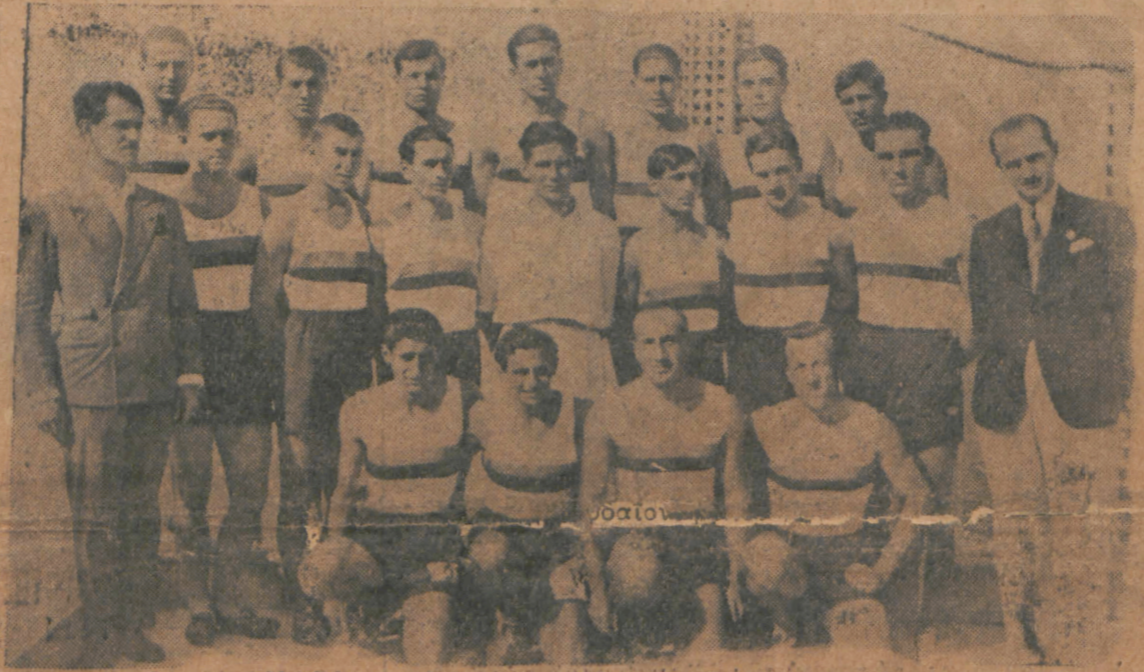
Η Εθνική ομάδα Βουλγαρίας όπου συμμετέχει εις την Ε. Βαλκανιάδα.