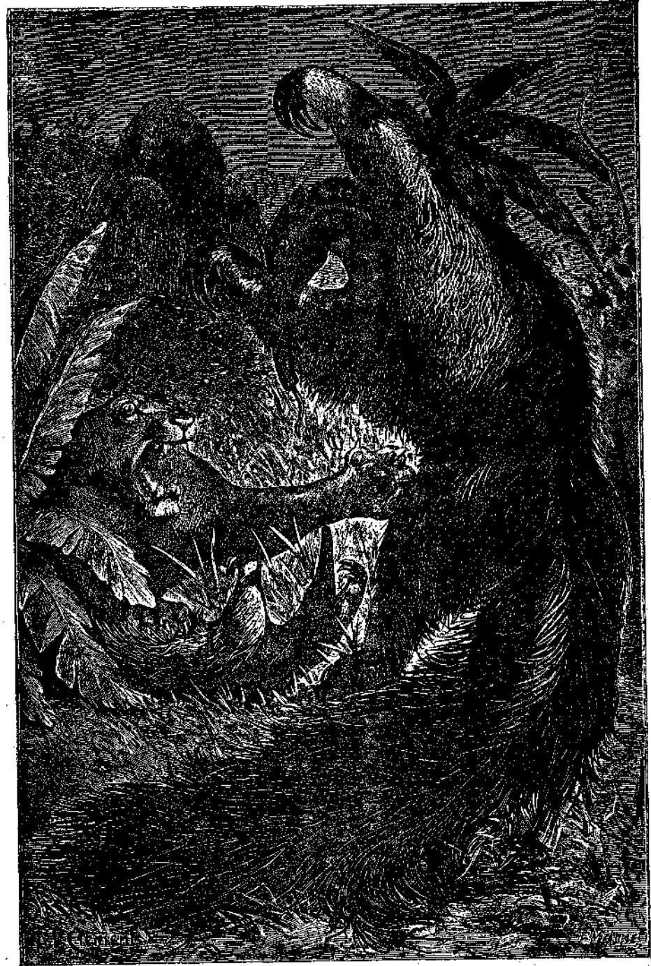
ΜΥΡΜΗΚΟΦΑΓΟΣ Ο ΜΕΓΑΣ

Διότι, εις έπίμετρον της δυστυχίας των, ο φόβος διπλωματικῶν περιπλοκῶν έμποδίζει την παρέμβασιν των γειτονικῶν κρατῶν, Χιλῆς και Αργεντινῆς. Οὕτω δε άκωλύτως και υπό τας όψεις του πολιτισμένου κόσμου σπειρα λευκῶν κανιβάλων καταγίνεται εις την εξόντωσιν μιᾶς άνωθροπυνηγῆς φυλής τόσον ένδιαφερούσης και τόσον άδίκως κριθείσης υπό του Δαρβίνου.