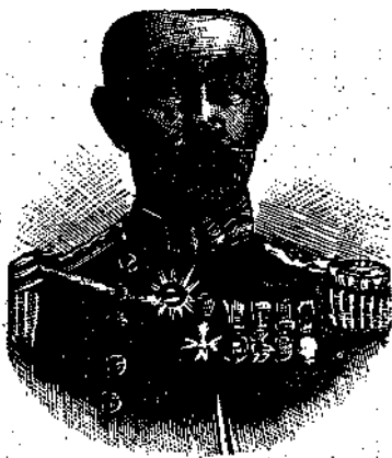
Ο ΝΑΥΑΡΧΟΣ ΤΟΓΚΟ

ΡΩΣΣΙΚΟΝ ΚΑΦΕΣΤΙΑΤΟΡΙΟΝ ΕΝ ΠΟΡΤ-ΑΡΘΟΥΡ, όπου συνέρχονται οί ξένοι, έναντι τοῦ Διοικητηρίου. Μετὰ τὰς ἐπανειλημμένας ἐπιθέσεις τῶν Ἰαπωνίων κατὰ τοῦ Πόρτ-Αρθούρ καὶ τῆς μεταθέσεως τῶν στρατ. ἀρχῶν εἰς Μοῦνγκεν, διαταγῇ τοῦ φρουράρχου οἱ πλείστοι τῶν κατοίκων ἀνεχώρησαν ἐπίσης εἰς τὰ ἐνδοτέρα, καὶ πολλὰ καταστήματα ἐκλείσαν ἐκ φόβου μὴ πάθωσιν ἐκ βομβαρδισμοῦ. Πολλὰ ὅμως γυναῖκες δὲν ἠθέλησαν νὰ φύγωσιν, ἀλλ' ἐπροτίμησαν νὰ καταταχθῶσιν ὡς νοσοκόμοι ἐν τῷ στρατῷ.