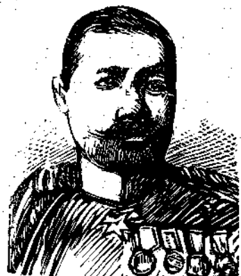
Ο ΣΤΡΑΤΗΓΟΣ ΟΚΟΥ

Ὁ ναύαρχος Τόγκο εἶνε τύπος στρατιώτου γενναίου καὶ ἀφοσιωμένου ὀλοφύχως εἰς τὸ καθήκον. Ἐτιμήθη δ' ἐπανειλημμένως διὰ παρασήμων.