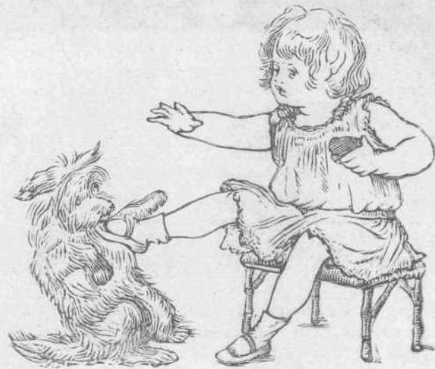
Φύγεῦθός ἀπὸ ἐμπρός μου, λαιμαρροῦδικο σκυλλ.