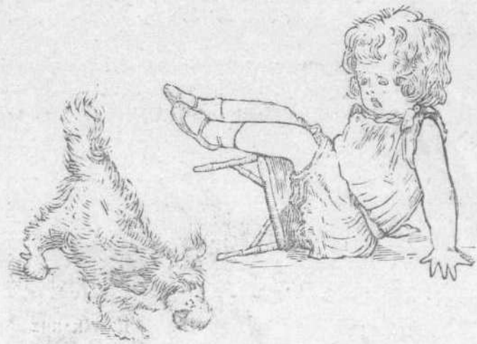
"Αχ! μαμά μου! τὸ ψωμί μου ε' ἔρχάται ἡ Αἰλῆ.