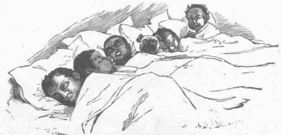
Φίλοι ἐξ καὶ εἰς τὸν ὕπνον

Εἰς τὸν προκηρυχθέντα πρωτότυπον «Λακωνικόν» διαγωνισμόν ἔλαβον μέρος· πενήτηντα πέντε.