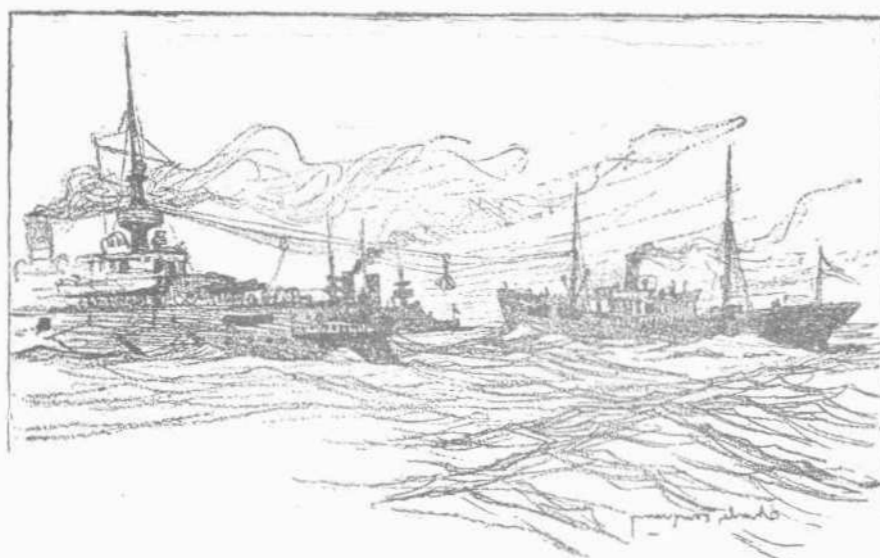
ΑΝΘΡΑΚΕΥΣΙΣ ΤΟΥ ΡΩΣΣΙΚΟΥ ΣΤΟΛΟΥ ΕΝ ΜΕΣΩ ΠΕΛΑΓΕΙ