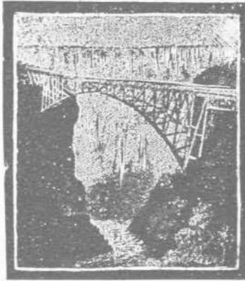
θέραι, ἤδη δὲ ἐπερατώθη. Ὁ σιδηρόδρομος ἀπέχει 1500 χιλιόμετρα ἀπὸ τὸ Κεϊπτάουν.

Ἡ κατασκευὴ ἤρξατο καὶ ἀπὸ τὰ δύο μέρη ταυτοχρόνως καὶ πυρετωδῶς ἀπὸ τὸ παρελθόν