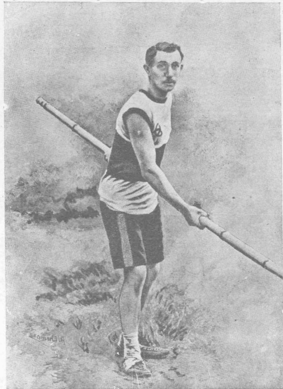
Ο ΝΙΚΗΤΗΣ ΤΟΥ ΑΛΜΑΤΟΣ ΕΙΣ ΥΨΟΣ ΕΠΙ ΚΟΝΤΩ: ΓΑΛΛΟΣ ΚΟΝΔΕΡ