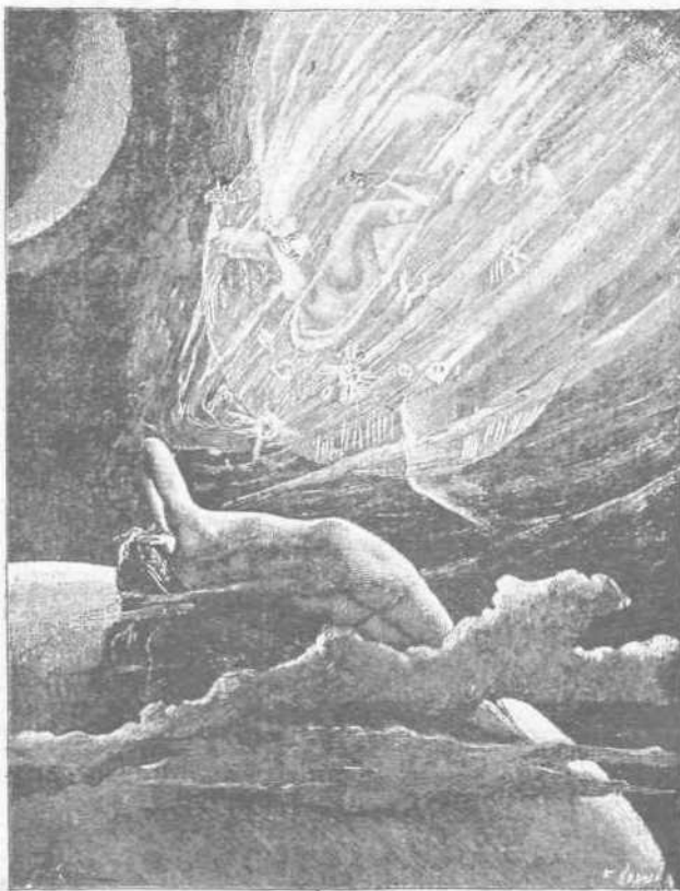
Ἡ Καταδιώκουσα Τύχη.

Πολλὰ ὄνειρα εἰ- σὶν ἀμφίβολα καὶ ἀσαφῆ, τινὰ ὅμως εἰσὶ τοσοῦτον ὡ- ρισμένα καὶ θετι- κά, ὥστε δὲν ἐπι- δέχονται ἀμφίβο- λίαν περὶ τῆς αὐ- θεντικότητός των. Τὰ τελευταῖα δὲ ταῦτα εἰσὶ σπά- νια, ἡ δὲ ἐπιστή-