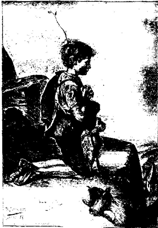
Η προσοχή του μικρού βροκού

ταλλικήν, αναφλεγμένην κτλ. και ο Άγγλος Λοκίερως ως μετέωρον κοσμικής κίνεως. Άλλ' οι υποθέσεις αυτές κρίνονται ανεπαρκείς, όπως ανεπαρκείς τυγχάνουσιν οι πλείους των κοσμολογικών θεωριών των αστρονόμων, ή αμοιβαία έλξεις των σωμάτων του Νεύτωνος, ή πυρώδης αργή των κατάρτασις της γης και είτε βαθμιαία αύτης κατάψυξις, ή ουσιαστική ιδιότης των ήλιων, κτλ.