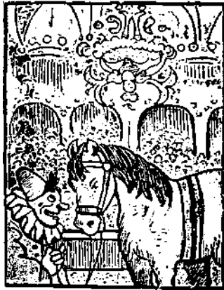
Πού είναι η χορεύτρια;