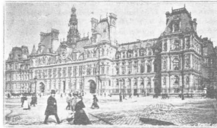
ΤΟ ΔΗΜΑΡΧΙΚΟΝ ΜΕΓΑΡΟΝ ΤΩΝ ΠΑΡΙΣΙΩΝ

μετὰ μεγάλης καὶ ζηλευτῆς ταχύτητος. Εἰς ἐν τούτων ἐπεβιάσθημεν καὶ ἡμεῖς, παρὰ τὸ Λουβρον καὶ ἀπήραμεν ἀμέσως διὰ τὰς Βερσαλλίας, διότι συνήθως ὀλίγον παραμένει εἰς ἕκαστον σταθμὸν.