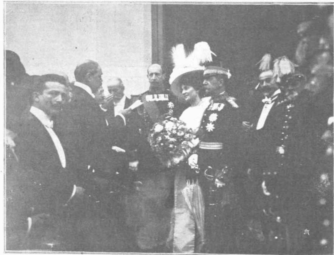
ΕΙΣ ΤΟΝ ΣΤΑΘΜΟΝ ΤΩΝ ΑΘΗΝΩΝ, ΕΝΘΑ ΤΟΥΣ ΠΡΟΣΦΩΝΕΙ Ο ΔΗΜΑΡΧΟΣ

Ο Μητροπολίτης ήτοίμασεν άκόλουθως τούς στεφάνους, είδος στεμμαίων χρυσών — των αυτών ών έγινε χρήσις κατά τούς γάμους του Διαδόχου — φερόντων εις τήν κορυφήν τόν σταυρόν. Έπρωχώρησαν οι παρώνυμο-