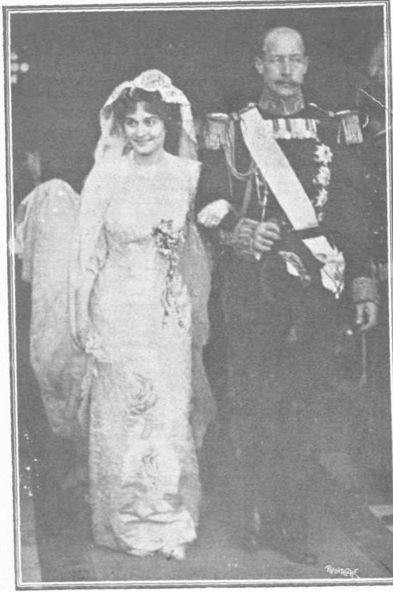
ΕΣΘΗ ΤΗΣ ΜΗΤΡΟΠΟΛΕΩΣ. ΜΕΤΑ ΤΗΝ ΤΕΛΕΣΙΝ ΤΩΝ ΓΑΜΩΝ

φοι, οτινας ησαν εκ μερους του πριγκηπος ο πριγκηψ Νικόλαος μετά του πριγκηπος Χριστοφόρου και του επιδόξου διαδόχου Γεωργίου, φερόντων των τελευταίων την στολήν του Ευέλπιδος. Έκ δε της νύμφης ο μαρκήσιος Βιλνέβ, εξάδελφος αυτής, με στολήν αξιωματικού του Γαλλικού Ναυτικού και οι μικροί βραδώνι Δ' Ωμπινύ, μικροί ανειδίτοι της, εν πολιτική περιβολή.