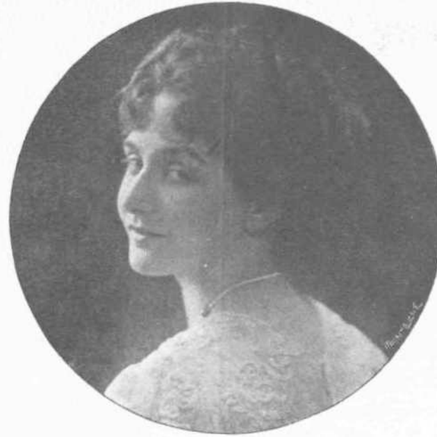
Η ΠΡΙΓΚΗΠΙΣΣΑ ΕΝ ΑΘΗΝΑΙΣ

Ο πριγκήψ Ρολάνδος ήρώμενος της Βασιλικής συνοδείας είταρχαμένης εις τόν ναόν, όδήγησε τήν νύμφην μέχρι του βάρους, εκεί δε ή πριγκήψ Γεώργιος λάθων τήν δεξιάν της, έφερε τήν νύμφην του πρό του βωμού. Οι Σιδοκρημάτατοι Συνοδικοί με τας δισποτικας στο-