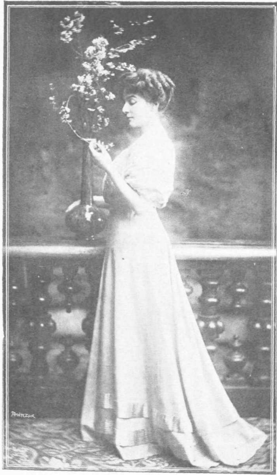
Η ΠΡΙΓΚΙΠΙΣΣΑ ΜΑΡΙΑ ΒΟΝΑΠΑΡΤΟΥ

Η συρροή του κόσμου ήτο και τι μοναδικόν. Ο έξο-