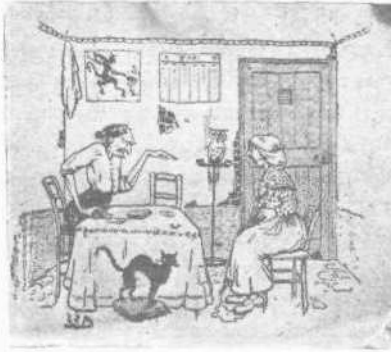
Ἡ προφητεία μιᾶς χαρτομάντιδος.