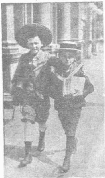
Η παιδική ζωή έχει ανάγκην πολλών προστίθων και περιποιήσεων. Είς παιδιά των έπαιων ή υγεία είναι ακατάστατος, τα γράμματα συντίθεν εις την τελείαν καταστροφήν και τοῦ σώματος.

Τό επόμενον έτος θ' αντικαταστήσωμεν την βρεγμένην σινδόνα διά δροσερού ύδατος, διά σινδόνης μουσχευμένης εις ψυχρόν τοιοῦτο επιμένοντες εις την τοιαύτην ψυχροθεραπείαν