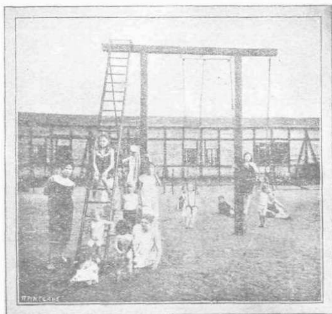
ΥΓΙΕΙΝΑ ΙΔΡΥΜΑΤΑ ΕΝ ΓΕΡΜΑΝΙΑ

Τὸ αερόστατον θὰ ὑψωθῆ μέχρις 800 μέτρων ὕψους, ὅπου ἀφικνεῖται, ὡς εἶπομεν ἡ ἀτμοσφαῖρα καὶ ἐκεῖ ἐπερχομένης τῆς ἰσορροπίας μετεξὺ τῆς πυκνότητος τῆς ἀτμοσφαιρας, ἀραιοτέρας οὖσης ἤδη ἐν