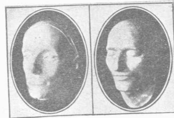
ΦΩΤΟΓΡΑΦΙΑ ΤΗΣ ΠΡΟΣΕΠΙΑΟΣ ΤΟΥ ΥΙΟΥ ΤΟΥ ΝΑΠΟΛΕΟΝΤΟΣ