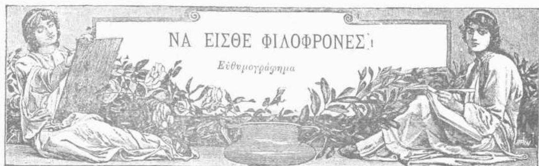
ΝΑ ΕΙΣΘΕ ΦΙΛΟΦΡΟΝΕΣ!