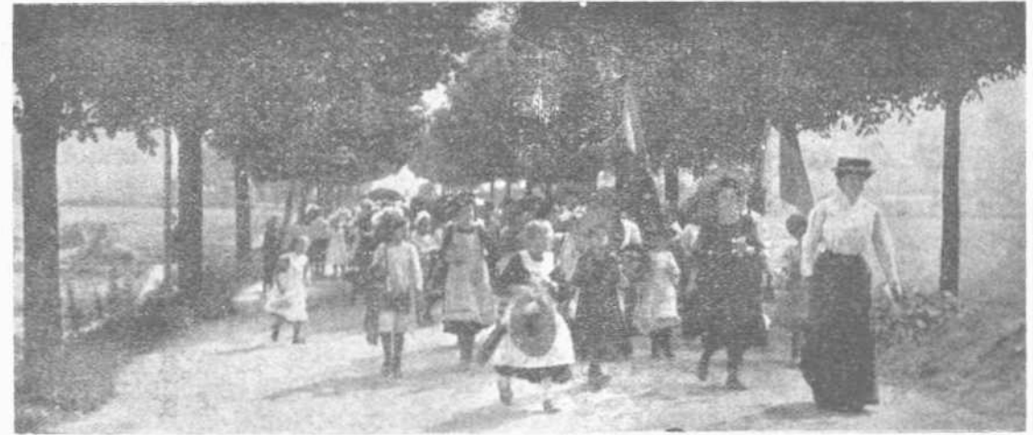
ΤΑ ΣΧΟΛΕΙΑ ΕΝ ΓΕΡΜΑΝΙΑ

Ας ίδωμεν πρώτον τί δύνανται να πράξουν οι πρώτοι. Εις την Γερμανίαν όπου υπάρχουν τα πρότυπα των δημοδιδασκάλων και διά τουςόποιους δικαίως λέγεται ότι είναι οι δρόσται του μεγαλείου της Γερμανίας, και συγχρόνως υπάρχουν και τα τελειότερα σχολεία, φροντίζουν περισσότερον διά την υγείαν των κατά κήν ηλικίαν ταύτην, και δεν προσπαθούν μόνον πώς να τα συνειθίσουν εις το ν' απαγγέλουν ως ψιττακοί κανόνας, όπως συμβαίνει συνήθως παρ' ήμιν. Τα σχολεία μεγάλα, εύρύχωρα, εύδαιρα και περιποιημένα, με όργανα