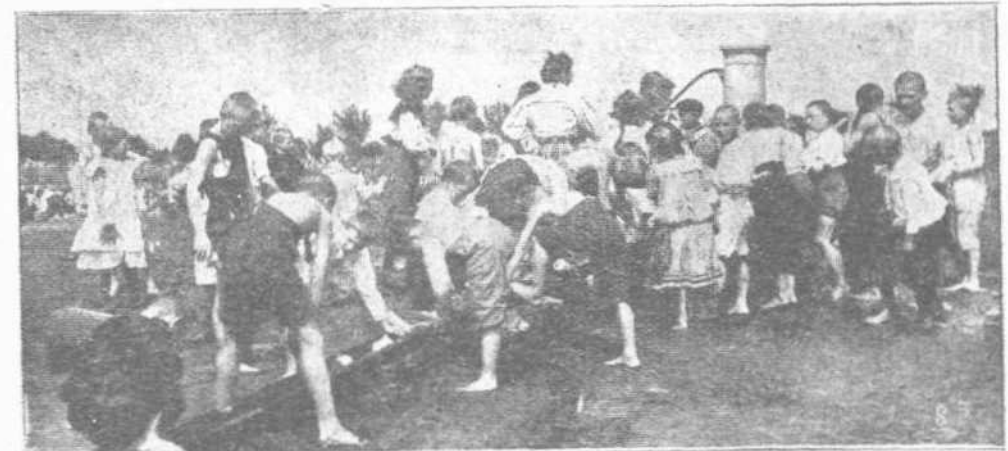
Μετά το τέλος των παιγνιδίων οι μικροί μαθηται και μαθήτρια αναμής πλήρονοι πόδας, χείρας και κεφαλής και ένδύομενοι επιστρέφον εις την πόλιν.

Ακριβώς περί του έναντίου πρόκειται. Δεν διασκεδάζουν ούτω πώς, διότι τότε δεν θα ήτο και τόση άνάγκη να μεταβούν εις την έξοχήν διά να κάμουν διασκεδάσεις καταλλήλους και διά τους σχολικούς των κήπους. Εις την έξοχήν δεν χρειάζονται αυτοί οι δαίμονες της υγείας τα ύποδήματα. Τα γυμνά πόδια τρέχουν ώραιώτατα εις τον βελούδινον άγρόν, γαργαλιζόμενα από την ύγρην χλόην. Έξω λοιπόν ύποδήματα, κάλτσες, βλοῦζες, φορέματα και καπέλα. Γυμνά τούς πόδας και τας χείρας, αναμής κοράσια και άγόρια, σκάπτουν, κτί-