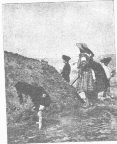
ΠΑΡΑ ΤΟΝ ΑΓΓΙΑΛΟΝ ΚΤΙΖΟΥΝ ΦΡΟΥΡΙΑ

εργετικήν συνήθειαν τῶν λουτρῶν. Τὰ σώματα γίνονται ελαφρότερα, καὶ ὁ νοῦς ἐργάζεται με μεγαλητέραν διαύγειαν.