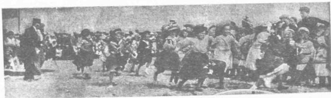
ΑΓΟΝ ΤΑΧΥΤΗΤΟΣ ΜΕΤΑΞΥ ΤΩΝ ΚΟΡΑΣΙΩΝ

Ἴδου δὲ μερικὰ λεπτομέρεια τοῦ βίου καὶ τῶν ἐθίμων τῆς μαθητικῆς ζωῆς πόλεως τινος τοῦ Βελγίου, τῆς Ὀστάνδης, ἡτις βεβαίως δὲν ἀποτελεῖ καμμίαν ἐξαιρέσιν μεταξὺ τῶν ἄλλων πόλεων τοῦ αὐτοῦ καὶ τῶν ἄλλων γειτονικῶν καὶ μὴ κρατῶν.