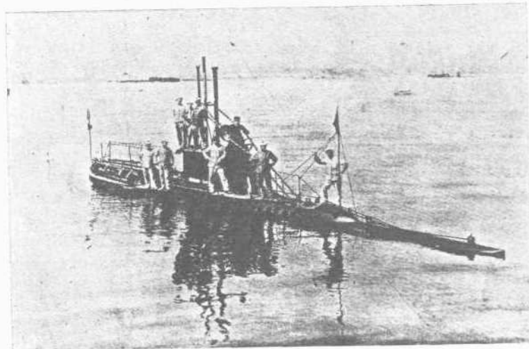
ΤΥΠΟΣ ΓΑΛΛΙΚΟΥ ΥΠΟΒΡΥΧΙΟΥ

Τ Ο ΖΗΤΗΜΑ ΠΕΡΙ ΥΠΟΒΡΥΧΙΩΝ.—'Επ'εύκαιρία του εξεγεθέντος πατάγον κατ' αὐτὰς διὰ τὴν ὑπὸ τῆς Ἑλληνικῆς Κυβερνήσεως ἀποδοχὴν τοῦ προγράμματος τοῦ ναυάρχου Φουρνιέ, δημοσιεύσμεν τὸν τύπον τῶν γαλλικῶν ὑποβρυχίων, ἅτινα συμβουλεύει ἡμῖν νὰ κατασκευάσωμεν.