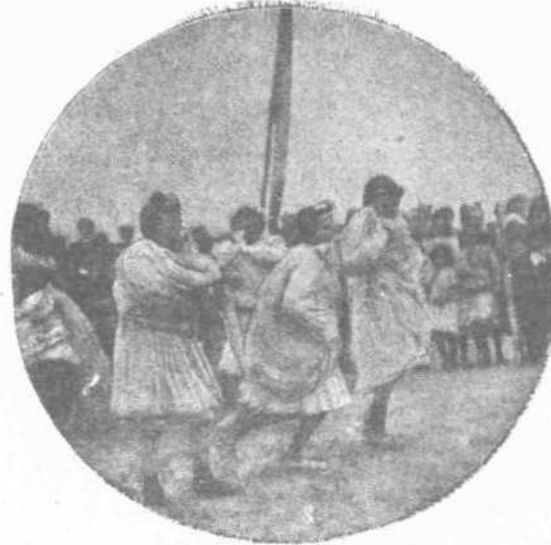
ΑΓΟΝ ΤΑΧΥΤΗΤΟΣ ΚΟΡΑΣΙΩΝ ΜΕ ΤΑΣ ΧΕΙΡΑΣ ΦΥΛΑΚΙΣΜΕΝΑΣ

Ἐν μέσῳ τοῦ σχολικοῦ ἔτους ἐκτὸς τῶν τακτικῶν ἡμερῶν τοῦ περιπάτου, ἐκδρομῶν καὶ ἑορτῶν καθιερώθη καὶ ἡ λεγομένη «Παιδικὴ ἐδδομάς». Διὰ τοὺς μαθητὰς τῆς Ὀστάνδης αἱ δύο αὗται λέξεις περιλαμβάνουν ὅλα τῶν τὰ ὄνειρα καὶ τοὺς πόθους. Παιδικὴ ἐδδομάς σημαίνει ἡ ἀνακήρυξις τῆς ἀπολύτου ἐλευθερίας τῆς τρέλλης αὐτῆς ἡλικίας, καὶ ἡ ἐπὶ ἐφθήμερον μετατροπὴ εἰς φρενοκομεῖον ὄλων τῶν σχολειῶν. Εἶνε ἡ βασιλεία τῶν παιδίων ὅπου ὅλα αὐτὰ τὰ ἀνάμικτα γένους διαβολάκια, μεταφέροντα τὴν ἔδραν τοῦ βασιλείου τῶν ἐκ τῆς πόλεως εἰς τὴν ἐξοχὴν, ἐπιιδίδονται εἰς τὰ κληρονομηθέντα ἀπὸ γενεᾶς εἰς γενεάν παίγνια καὶ τέρψεις καὶ μὴ ἀρκούμενα εἰς ταῦτα ἐφευρίσκουν καὶ νεώτερα. Ἐννοεῖται ὅτι ὅλα αὐτὰ γίνονται ὑπὸ τὴν ἐποπτείαν τῶν διδασκάλων καὶ διδασκαλισσῶν, τῆ συνδρομῆ τῶν καὶ συμμετοχῆ τῶν ἀκόμη.