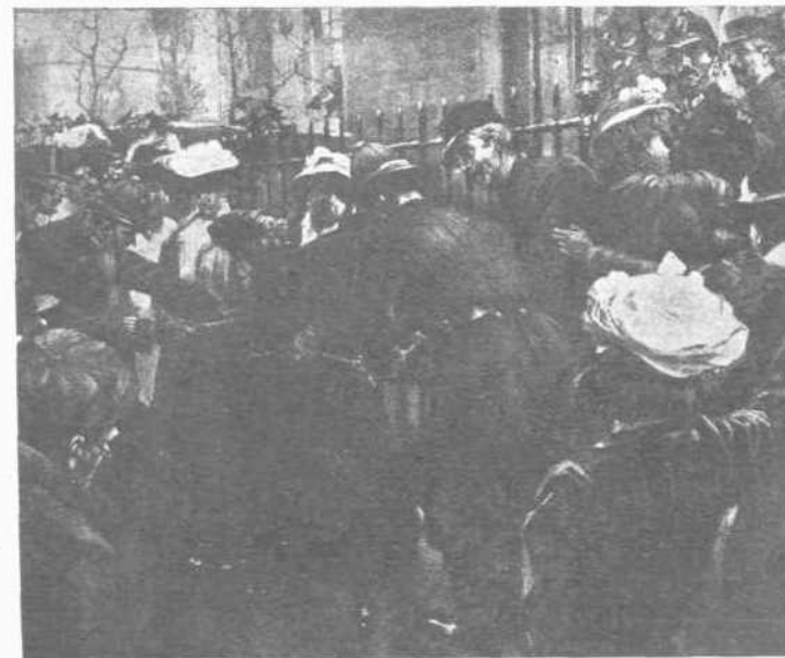
ΑΙ ΓΥΝΑΙΚΕΣ ΕΝ ΑΓΓΛΙΑΙ:

Θ ΑΓΩΝ ΤΩΝ ΓΥΝΑΙΚΩΝ ΕΝ ΑΓΓΛΙΑΙ: ΠΡΟΣ ΑΠΟΚΤΗΣΙΝ ΨΗΦΟΥ.—'Ο ὄμιλος τῶν Ἀγγλίδων σωφραζετῶν, ὡς ὀνομάσθησαν ἐν τῇ πατρίδι των αἰ ζητοῦσαι τὸ δικαίωμα ψήφου γυναῖκες, ἔχει ἀπὸ πολλοῦ χρόνου τὴν δημοσίαν προσοχὴν κινήσει διὰ τῶν ὅτε μὲν κωμικῆς, ὅτε δὲ λίαν ἀηδοῦς μορφῆς ἐνεργειῶν των. Δις ἀπεπειράθησαν αἱ Σωφραζέτρες νὰ ἐφορμήσωσι κατὰ τοῦ Ἀγγλικοῦ κοινοβουλίου, καὶ προὐνόησαν πρὸς τοῦτοις ὑπὸ τοὺς ἀλλαλαγμοὺς τοῦ θεωμένου πλήθους ἐν τῇ δημοσίᾳ πλατεῖα ἀηδεῖς σκηνὰς, αἵτινες ὑπενθύμησαν τὰς ἀκολάστους καὶ ἀγρίας τοιαύτας, ὡς αἱ Γαλλίδες γυναῖκες τῆς ἀγορᾶς καὶ γυναῖκες τῆς στοῆς, κατὰ τὴν γαλλικὴν ἐπανάστασιν, ἠρέσκοντο νὰ κἀνωσιν. Αἱ μαινόμεναι σωφραζέτρες ἐπολέμησαν κατὰ τῆς ὑπερασπιζούσης τὸ Κοινοβούλιον ἀστυνομικῆς δυνάμεως, οὐ μόνον μὲ ὑβριστικὰς λέξεις,