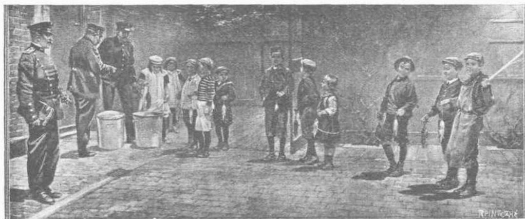
ΣΤΑΥΡΟΦΟΡΙΑ ΚΑΤΑ ΤΩΝ ΠΟΝΤΙΚΩΝ

Μ ΕΤΡΑ ΚΑΤΑ ΤΩΝ ΠΟΝΤΙΚΩΝ ΕΝ ΚΟΠΕΝΧΑΓΗ.—'Απὸ πολλοῦ χρόνου ἦτο ἀπεδεδειγμένον διὰ τῶν περαμάτων τοῦ Ροδέρτου Κώχ, ὅστις πρὸς σπουδὴν τῆς πανώλους ἐπεσκέθη τὰς Ἰνδίας, ὅτι οἱ ποντικοί, ὅσον ἀφορᾷ τὴν μεταφο-