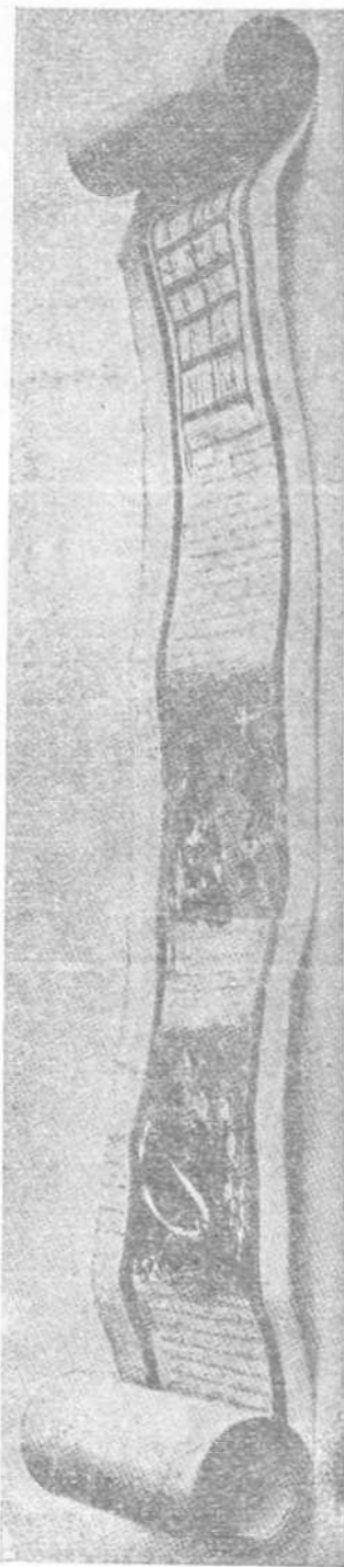
Ἑλληνικὸς πάθος τοῦ VI αἰῶνος, εὑρεθείς ἐν Ἄργῳ Αἰγύπτῳ καὶ περιγράφων γίαν ἱστοριαντῆς ἐπὶ ἀθήνης εἰκότος τοῦ Χριστοῦ.

Ἡ εἰκὼν ἐκτίθεται εἰς δημόσιον προσκύνημα τὴν Πεντηκοστήν καὶ τὰς δύο ἀκολουθούς ἡμέρας.