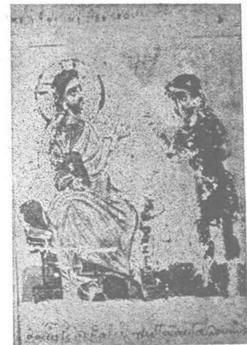
Ὁ Ἰησοῦς λαμβάνων τὴν ἐπιστολὴν τοῦ Ἀβγά.

Ἐν Γενοῦῃ ἡ ἀγία καὶ πολύτιμος εἰκὼν ἀνετέθη εἰς τὴν Ἐκκλησίαν τοῦ ἁγίου Βαρθολομαίου, ὅπου μετὰ πολλὰς περιπετείας—διότι λόγον χάριν κατὰ τὸ 1507 ἐκλάπη καὶ