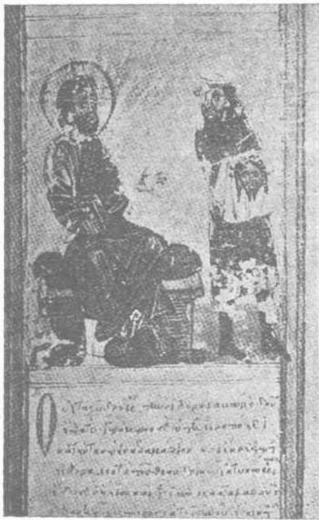
Ὁ ἀπεσταλμένος φέρων εἰς τὸν Ἀβγά τὴν εἰκόνα.

Εἰς τὴν ἐπιστολὴν ταύτην ὁ Ἰησοῦς ἀπήντησεν ὅτι δὲν δύναται νὰ μεταβῇ εἰς Ἐδεσσαν,