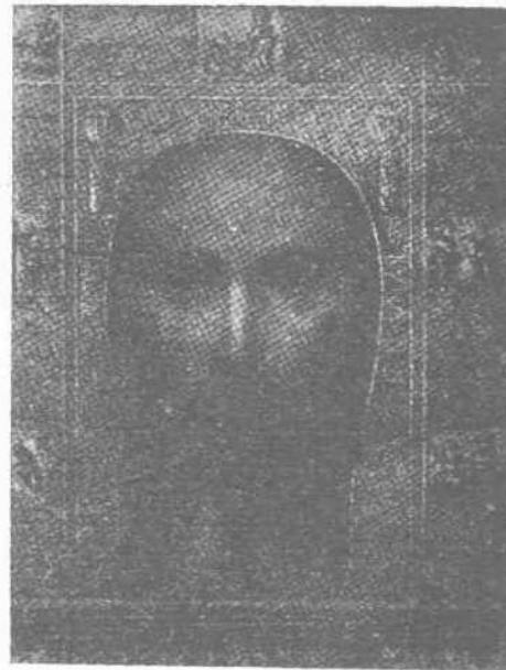
Ἡ ἐπὶ τῆς οὐράνης εἰκὼν ὡς εὑρίσκεται νῦν ἐν Γενοῦῃ εἰς τὴν ἐκκλησίαν τοῦ Ἁγίου Βαρθολομαίου

διότι ὀφείλει νὰ ἐκκληρώσῃ ὅλην τὴν ἀποστολὴν, ἡ ὁποία τῷ ἀνετέθη καὶ ἀκολούθως θὰ ἀνέλθῃ εἰς τὸν Ὑψιστον, ὁ ὁποῖος τὸν ἀπέστειλε. Θάποστειλῇ ὁμοῦ εἰς Ἐδεσσαν ἕνα τῶν μαθητῶν του, τὸν Θαδδαῖον τὸν ἢ Θωμᾶν, ὁ ὁποῖος θὰ τὸν θεραπεύσῃ καὶ θὰ προνοήσῃ ὥστε ἡ πόλις αὐτοῦ νὰ μὴ καταληφθῇ οὐδὲ νὰ καταστραφῇ ὑπὸ τῶν ἐχθρῶν.