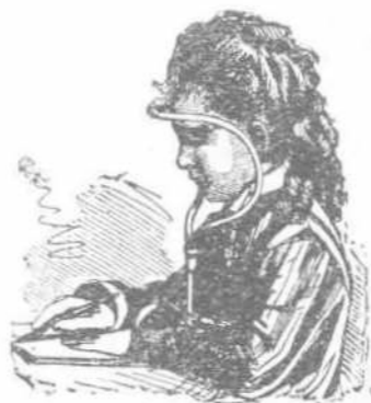
ΤΟ ΜΗΧΑΝΗΜΑ ΤΟΥ KALLMANN

Τὸ ἀνωτέρω περὶ σχολείων εἰρημένον δεικνύου-