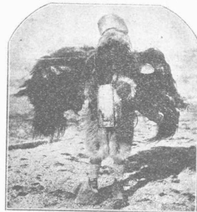
Φορτωμένοι μετὰ τὰς ζωοτροφίας των καὶ τὰς μηλωτάς, οἱ ἐξε- ρευνηταί διασχίζουν τὰς χιόνιας τῶν πόλων.

Ἡ μεγάλη ἐκείνη ὑπὸ τὸν Σκῶτ ἀπο- στολὴ εἶχεν ἀνακα- λύψει νέας μεγάλας ἐκτάσεις γῆς Νοτιο- δυτικῶς καὶ Νοτιο- νατολικῶς τοῦ Με- γάλου Παγετώματος τοῦ Ρὸς, πέραν τοῦ ὁποῦν οὐδὲς προγενέστερος ἐξε- ρευνητὴς κατώρ- θωσε νὰ προχωρή- σῃ. Διήλθον δὲ οἱ ἐξερευνηταί τῶν χειμῶνα ὀλόκληρον εἰς τοὺς πρόποδας τῶν ὄρεων ὁ Ἐρε- βος καὶ ὁ Τρόμος, ὑπὸ ἐλαχίστην θερ- μοκρασίαν 62ο Φα- ρενάιτ ὑπὸ τὸ μη- δέν. Κατὰ δὲ τὴν ἄ- νοιξιν ὁ Σκῶτ μετὰ τοῦ δόκτωρος Οὐίλ- σον καὶ μετὰ τὸν ἀνθυποπλοίαρχον Σάκλετον