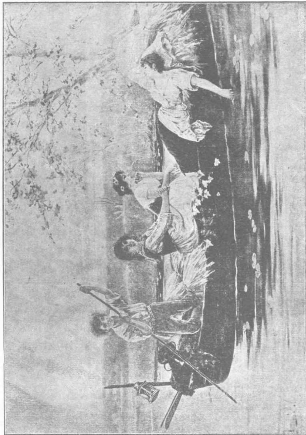
Δὲν ὑπάρχει εὐαρεστοτέρα ἀπόλαυσις τῆς ἀναπαύσεως καὶ διασκεδάσεως κατὸν ἐπιτυχῶς καὶ ἱκανοποιητικῆς ἐργασίας. ΕΠΙΣΤΡΟΦΗ ΕΚ ΤΗΣ ΕΡΓΑΣΙΑΣ