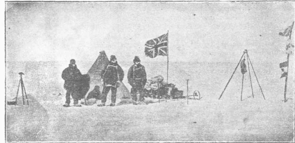
ΧΡΙΣΤΟΥΓΕΝΝΑ ΥΠΟ ΘΕΡΜΟΚΡΑΣΙΑΝ 27 ΒΑΘΜΩΝ ΥΠΟ ΤΟ ΜΗΔΕΝ !