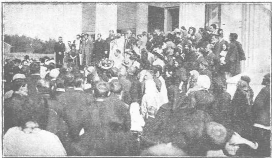
Η ΤΕΛΕΤΗ ΤΩΝ ΕΓΚΑΙΝΙΩΝ ΤΟΥ ΝΑΟΥ ΚΑΙ Ο ΛΟΓΟΣ ΤΟΥ ΕΛΛΗΝΟΣ ΠΡΟΞΕΝΟΥ