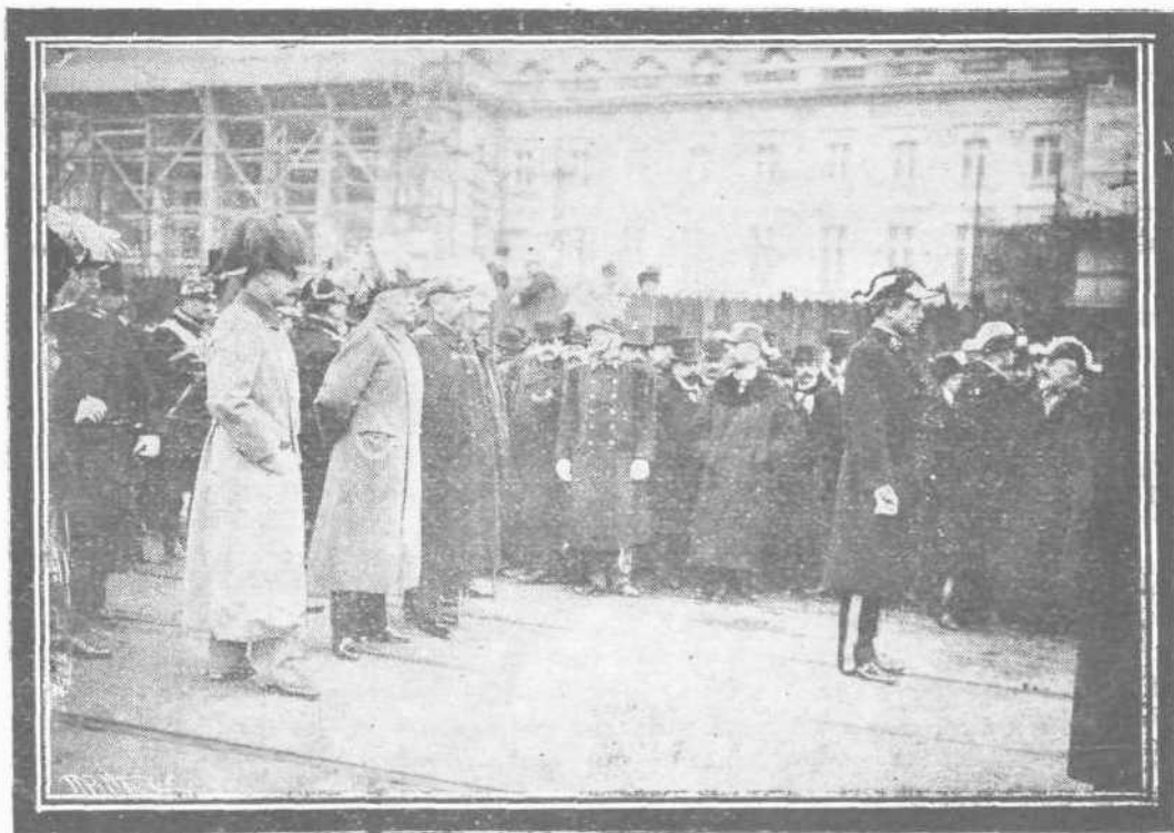
Ο ΝΕΟΣ ΒΑΣΙΛΕΥΣ ΤΟΥ ΒΕΛΓΙΟΥ ΛΑΒΕΡΤΟΣ ΠΑΡΑΚΟΛΟΥΘΕΙΝ ΤΗΝ ΚΗΔΕΙΑΝ ΤΟΥ ΠΑΤΡΟΣ ΤΟΥ

Καὶ δὲν εἶναι τις βέβαιος περὶ τῆς ἀκριβοῦς ὥρας τῆς ἐπισκέψεώς του, ἀποφαίνονται οἱ ἀστρονόμοι. Ὁ δὲ Houlteuigne λέγει ἐν τῇ «Ἐπιθεωρήσει τῶν Παρισίων, ὅτι «Δὲν εἶναι ποτέ τις βέβαιος περὶ τῆς πίστεως τῶν κομητῶν». «Ὅστις δὲ λέγει κομήτην, λέγει γυναῖκα «εὐθραυστόν τι», ἀποφαίνεται ὁ Σαίξπηρ. Ἄλλ' ἐν τούτοις ἔχομεν λόγους γὰρ ἐλ-