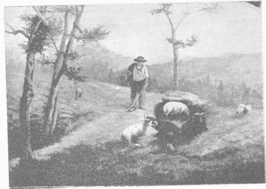
ΜΙΑ ΕΚ ΤΩΝ ΕΛΛΗΝΟΓΡΑΦΙΩΝ ΤΗΣ ΚΑΛΛΙΤΕΧΝΙΔΟΣ ΙΟΥΛΙΑΣ ('Ο ποιμὴν εἰς προσοχὴν').

Πλὴν ἡ λευκούλειος αὐτὴ καὶ ὀρεκτικὴ, εὐγεστος καὶ εὐωδιῶσα μακαρονὰς ἦτις, ὡς ἐξελαστήριον θύμα παχύσαρκος ἔκειτο κατὰ μῆ-