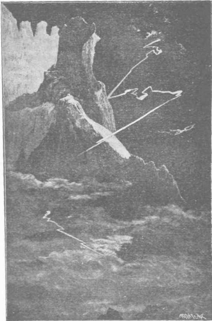
Ὀψιαστικὴ παράστασις τοῦ κεραυνοῦ.

Πρὸ παντός παρατηροῦμεν, ὅτι δὲν πρέπει νὰ φοβόμεθα τὸν κρο-