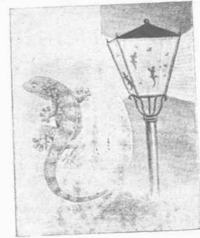
Ἡ Σαῦρα «Geckos» ἀναρριχωμένη ἐπὶ τῶν ὑάλινων τοίχων τοῦ κλωβοῦ τῆς.

Θὰ ἠδύνατο δὲ τις ἐτι πολλῶν εἰδῶν ἰδιαζούσας κινήσεις νὰ ἀναφέρῃ καὶ ἐξετάσῃ, ὡς π. χ. τὸ κυρτοειδὲς βᾶδισμα τῶν βδελλῶν, τὴν ὀπισθοδρομικὴν κίνησιν πολλῶν ζώων, τὴν