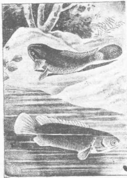
Ἐρπων ἰχθύς (Anabas Scadens) δυνάμενος καὶ ἐπὶ τῆς ξηρᾶς νὰ κινῆται.

ρον ἢ καὶ ἐντελῶς νὰ μὴ ὑπάρχη, ὡς εἰς τὰ δίπτερα (μυῖαι). Ἐπίσης ὅπως ἀπτερὰ ἔντομα εἶναι γνωστά, ὡς τὰ θήλας διαφόρων πυγολαμπίδων. Εἰς τὰ ἔντομα, ἄτινα δύνανται μακροτάτως πτήσεις νὰ ἐκτελέσωσι, ὑπάρχουσιν τοιοῦτα καὶ ταχύτερον βέλους συρίζοντα τὰ ὅποια αὐτὴ ἢ χελιδῶν δὲν δύναται νὰ προφθάσῃ ἰπτάμενα, μεταξὺ τῶν ψυχῶν αἱ μακρόπτεροι, μεταξὺ τῶν διπτέρων οἱ οἰστροί, μεταξὺ τῶν ὑμενοπτέρων αἱ μέλισσαι καὶ αἱ σφήκες. Κατὰ καιροὺς ἐξέρχονται κατὰ τὴν ἡμέραν αἱ τῶν ἀνθέων ἐπιπέταται μέλισσαι καὶ πετῶσιν ἐδῶ καὶ ἐκεῖ μετὰ ζήλου τὸ μέλι συλλέγουσαι. Ἀκαταπόνητοι χορεύουσιν οἱ κώνωπες τὸ γαμήλιον αὐτῶν ἄσμα, ἐνῶ πάλιν ἄλλα ἔντομα, ἂν καὶ φέρουσιν πτέρυγας, εἶναι ὀλίγον κύρια τῶν πτερυγῶν τῶν καὶ ἀναγκάζονται νὰ κἀμνωσιν εἰδός τι πτερυγίσματος μὲ δικαιοσύνη καὶ μετ' ἀναπαύσεως.