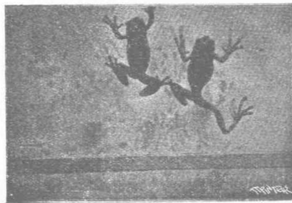
Βάτραχοι τῆς Αὐστραλίας «Κορλλιδοάκτυλοι» ἀναρριχωμένοι ἐπὶ τῶν τοιχωμάτων τοῦ ὕψιου αὐτῶν κλωβοῦ.

Πρὸς κίνησιν ἐπὶ τῆς ξηρᾶς εἶναι κατάλληλα ἐπίσης πολλὰ ζῶα ἐκ τῶν ἰπταμένων καὶ κολυμβῶντων ζώων, ὡς π. χ. ὅλα τὰ πτηνά, ἂν καὶ τὸ βῆμα τοῦ πραγματικοῦ ὑδροβίου πτηνοῦ ἐπὶ τῆς ξηρᾶς εἶναι πάνυ ἀδέξιον καὶ ἀσταθές. Ἐπίσης καὶ τὰ πτερυγίσποδα π.χ.