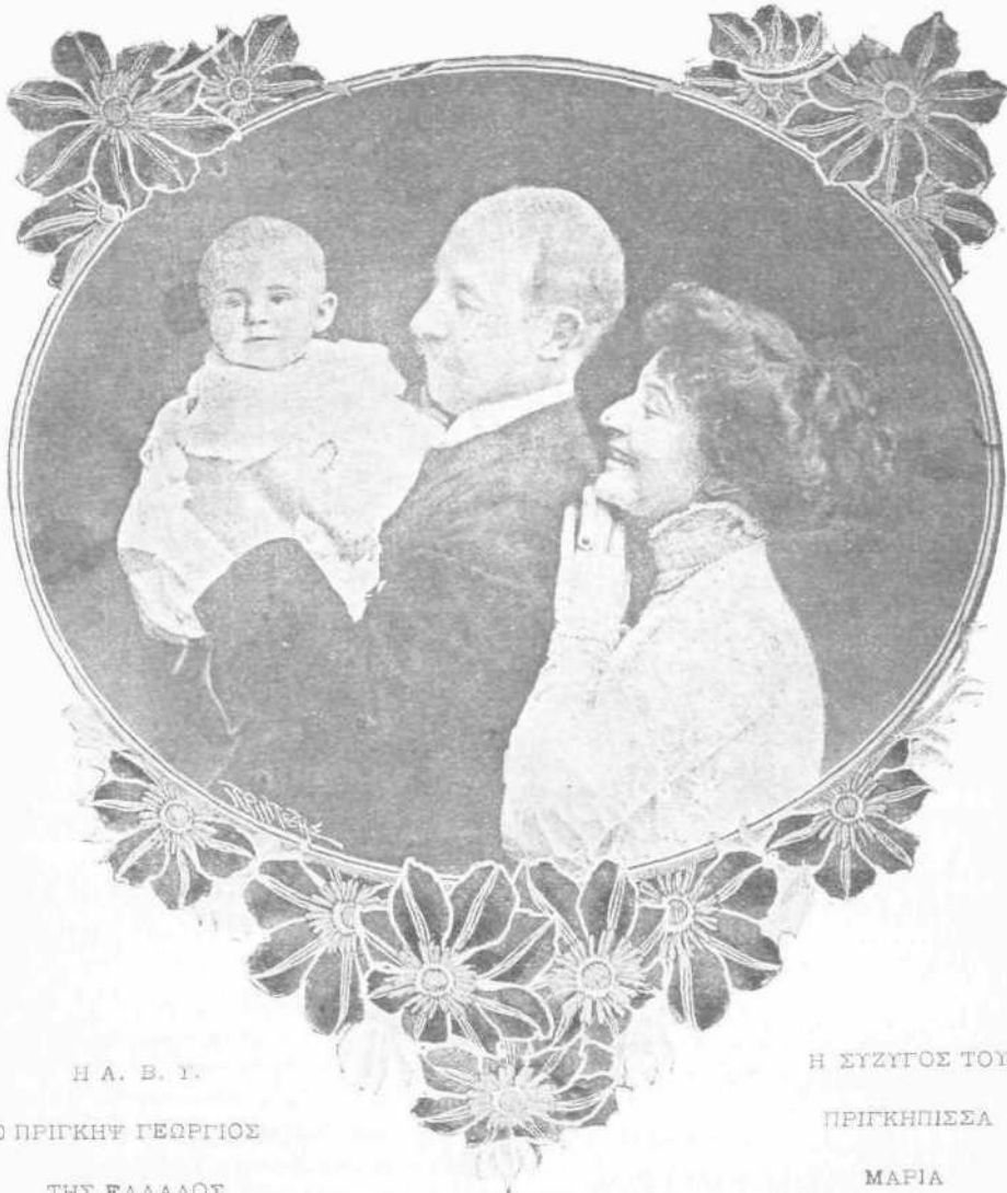
Η Α. Β. Υ.