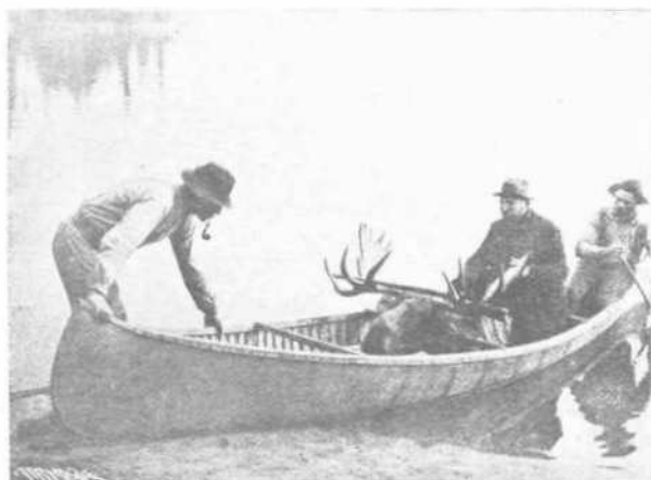
Μετῴρισάμεν αὐτὴν διὰ λυθῶν εἰς τὴν ὀκνηνὴν μας.

Ἐν εἶδει πρωτοπορείας ἐτάχθησαν οἱ τρεῖς