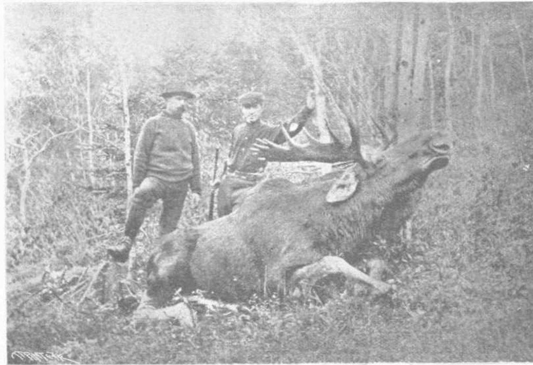
Η ΑΛΚΗ ΤΩΝ ΑΓΡΙΩΝ ΔΑΣΩΝ ΤΗΣ ΒΟΡΕΙΟΥ ΑΜΕΡΙΚΗΣ

Ἐπιποσίδαν αὐτὸ καὶ θθαύμαζαν τὸ μέγεθος καὶ τὰ ὠραῖα τὸν κέρατα.