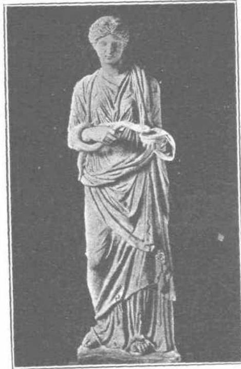
Τὸ ἐν τοῖς Ἀσκληπιείοις ἄγαλμα τῆς Ὑγίαιας.

ὑποβάλλεται εἰς ἀδοτηρὰν καθαρότητα καὶ διαίταν ἀπολύτως ὑγιεινὴν, λαμβάνων καθ' ἑκάστην θερμὰ λουτρά. Κατὰ τὸ διάστημα τοῦτο διατρέφεται ἐκ τοῦ κρέατος τῶν θνῆσζόμενων ζῶων πρὸς τιμὴν τῶν διαφορῶν τοῦ ἄλσους θεῶν. Πρὸ ἐνὸς ἐκάστου τῶν σφαζομένων τούτων ζῶων ἵσταται μάντις ἱερεὺς, ὅστις ἐξετάζει πρότερον μετὰ προσοχῆς τὴν ποιότητα αὐτῶν καὶ προλέγει εἰς τὸν ἰκέτην, ἂν ὁ Θεὸς Τροφῶνιος θέλει τὸν δεχθῆν εὐμενῶς ἢ ὄχι. Ὡσαύτως κατὰ τὴν πρώτην νύκτα σφάζεται καὶ ἄλλος κριὸς, ἐκ τῆς ἐξετάσεως μόνον τῶν σπλάγγων τοῦ ὁποίου διαβιβαιοῦνται περὶ τῆς μελλούσης ὑποδοχῆς καὶ ἂν πρέπη νὰ κατέλθῃ ἐντὸς τοῦ