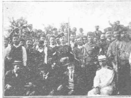
Όμάς σκοπευτών Κρητών διὰ τὰ «Έλευθέρια» μετά τής έλληνοδικου έπιτροπής.

Ίδρυσε σκοπευτικά παρατήματα εις όλους τους δήμους, έκτισε σκοπευτήρια, έχορήγησε όπλα μάνλιχερ και γκρά, φυσίγγια και στόχους. Έγκατέστησε εις τας έδρας των δήμων ει-