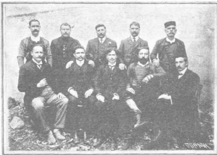
Τό διοικητικόν συμβούλιον του Συλλόγου «Αποκόρωνας»

Πόσοι Αποκορωνιώται ά γνωσῶν τώρα τον χειρισμόν του μάνλιχερ; Έλάχιστοι. Αλλά και αυτός ο Σύλλογος με τον δρόμον που επήρε θα τους κάμη όχι μόνον καλούς σκοπευτάς διὰ του τελευταίου όπλου, αλλά θα μετεδώση εις αυτούς καθώς και εις όλους, μεθ' ών έπικοινωνεί το ιερόν πυρ από το όποϊον εμπνέεται, διαλογιζόμενος, ότι όχι μόνον, έχει προορισμόν να άναδειχθῆ, αλλά και να άναδείξη και άλλους.