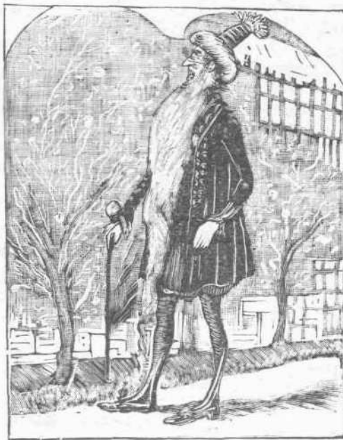
Εἶδεν ὅτι ἔλειπον δέκα ροδάκινά.

Καὶ πάλιν ὁμοῦς ἡ αὐτὴ σιωπὴ διεδέχθη τὴν ἐρώτησίν του.