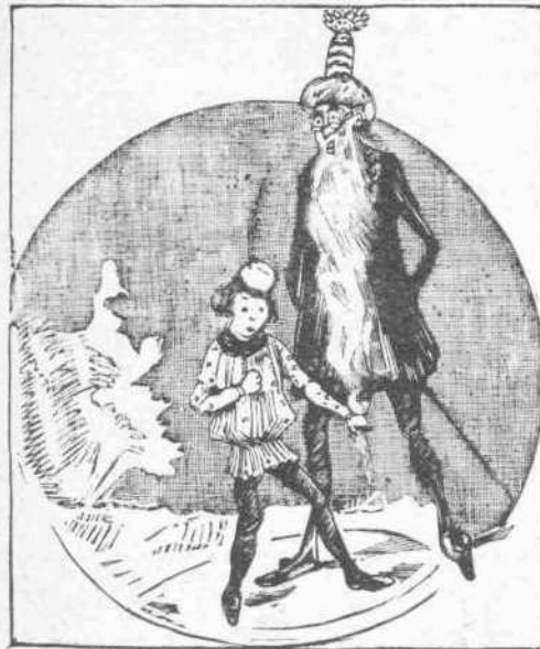
Ἐχάραξε περίξ τοῦ Ἐρμαν στενὸν κύκλον.

Καὶ τὸ χέρι ἀμέσως ὠμίλησε: «χθὲς εἰς τὰς ἑπτὰ τὸ ἑσπέρας, ὅτε ὁ κύριος ἔτρωγεν, εὐρέθη, δὲν εἰξεύρω πῶς, πλησίον εἰς τὰ ὠραία ροδάκινα. Κατ' ἀρχὰς τὰ ἐχάιδευσα, ἔπειτα ἐπῆρα ἐν μετὰ μεγάλην προσοχὴν μετὰ τὰ δύο δάκτυλά μου καὶ τὸ ἔφερα εἰς τὸν ἀδελφόν μου, τὸ στόμα, τὸ ὅποιον τὸ ἔφαγεν, ἀφῆσαν νὰ τρέξῃ εἰς ἐμὲ ὁ ζῶμος του, ὁ ὅποιος ἔκαμε νὰ εὐωιδιᾶξῃ ὅλον τὸ σῶμά μου. Ἐκοψα δέκα ἀπὸ τὰ ὠραία αὐτὰ ὀπωρικά καὶ τὰ ἔφερα ἐν πρὸς ἐν εἰς τὸν ἀδελφόν μου, τὸ στόμα».