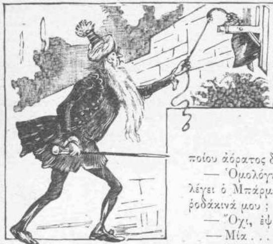
Ἦρχομαι νὰ σημαίῃ δεινὰτά.

Τότε μὲ τὴν ράβδον του, ἡ ὁποία εἶχε λαβὴν ἐλεφαντινὴν, ἐγράφαζε βραδέως εἰς τὸ γῶμα τοῦ κήπου ἓνα μεγάλον κύκλον περὶ τῶν ὑπηρετῶν του.