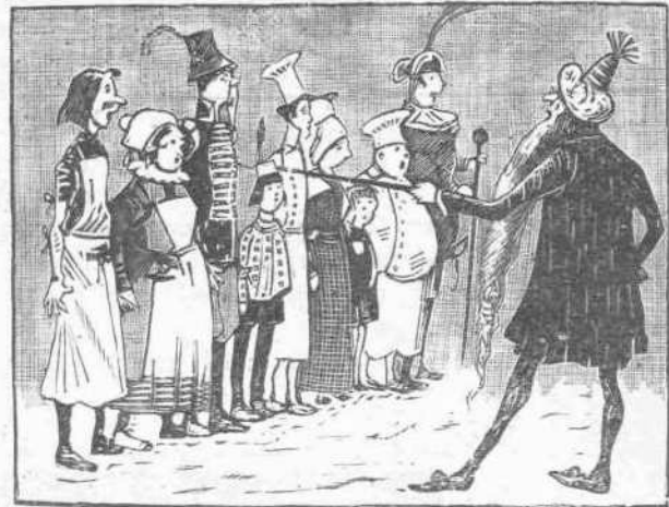
Ἠρώτησε μὲ θυμὸν: «Ποῖος ἀπὸ σᾶς ἐπῆρε τὰ ροδάκινά μου?»

Μόλις ἐτελείωσε τὸ μάτι, ἤρχισεν ἀμέσως τὸ πόδι τοῦ μικροῦ Ἐρμαν καὶ εἶπε τὰ ἐξῆς: «Πρὸ ὀκτὼ ἡμερῶν τῶ ὄντι μὲ ἔφερε τὸ μάτι πλησίον αὐτῆς τῆς ροδακινιάς· ἐστεκόμην ὁμοῦ πάντοτε ὀλίγον μακρὰν αὐτῆς. Ἀλλὰ γῆθές, ἀνέβην εἰς μίαν κλιμακὰ καὶ εὗρήθην ἀκριβῶς εἰς