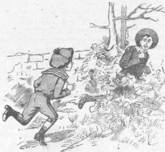
Αρχίζει λοιπόν τό παιγνίδιον...

Η πλατεία διαίρεται εις δύο στρατόπεδα: τους μεγάλους και τους μικρούς. Οι μεγάλοι, δώδεκα έως δεκαπέντε έτων, εξέλεξαν ως ιδιόν των μέρος πλησίον της γερύρας: εις φράκτης όλίγον πυκνός τους χωρίζει από ένα λειμώννα, ο όποιος τελειώνει