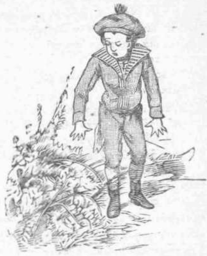
Κράκ!... μία άκανθα άποσπῆ έν τεμάχιον από τό πανταλόνι του!

Σήμερα οι μεγάλοι διωργάνωσαν έν λαμπρόν κυνήγιον — άνευ όπλων! Οι