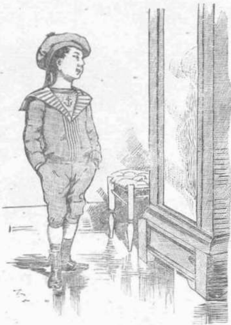
Τοποθετείται εμπροσθεν του καθρέπτου... και εξακολουθει να παρατηρή.

— Τότε πρόσεχε μη λερωθής πρό πάντων μην υπάχης εις τό μικρόν δάσος-του μύλου.