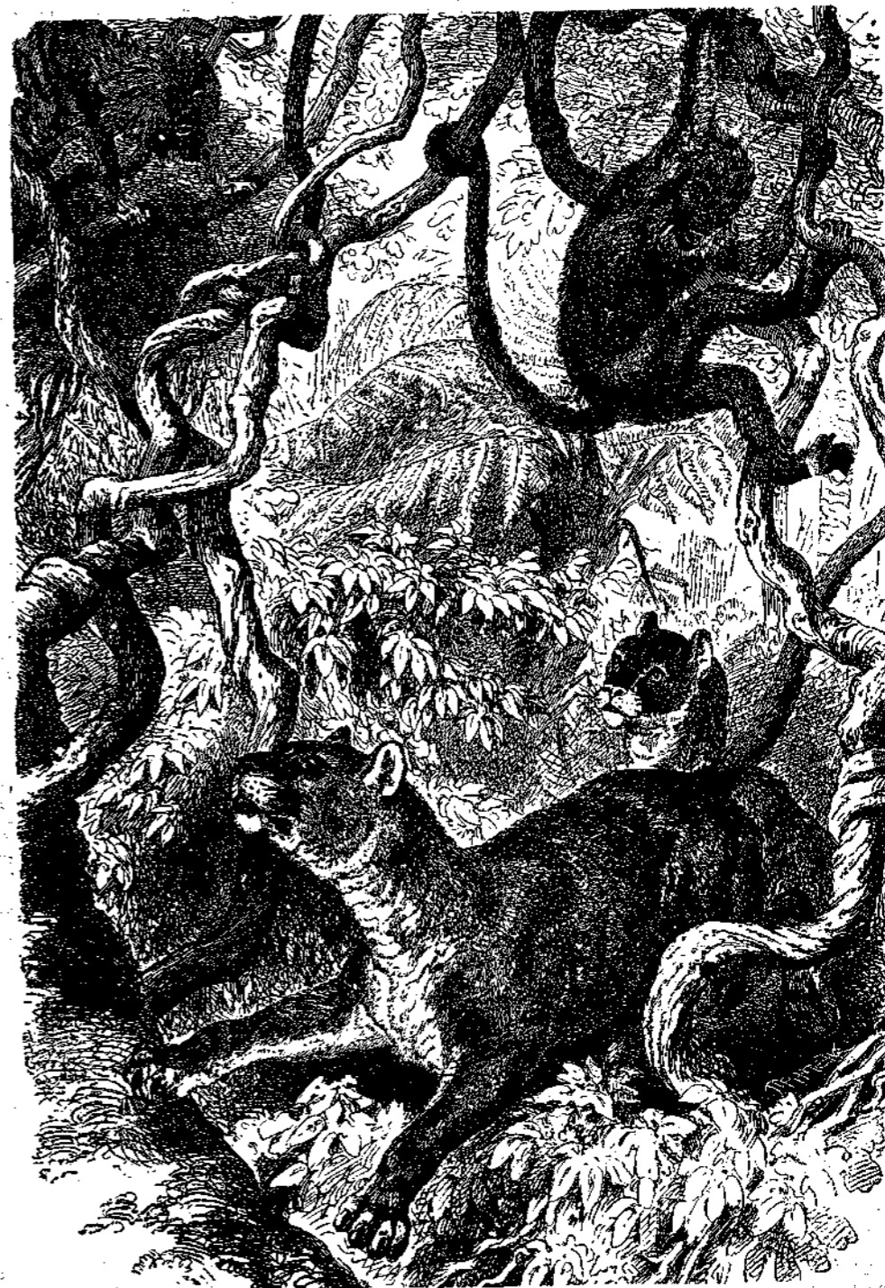
Ο ΛΕΩΝ ΤΗΣ ΑΜΕΡΙΚΗΣ—Ο ΠΟΥΜΑΣ