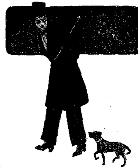
Τὸ σκυλάκι ἐκηκολούθει νὰ μὲ κηνοδεύῃ...

—Κηυρία μου, κηακῆκῶκῆκῆ κηακῶκῆκῆτε ἓνα νύκῆκῆ σκυλάκι κηαμένο. Τὶ κηακῆκῶκῆκῆ ποῦ εἶνε ! Δὲν ἀκηο-