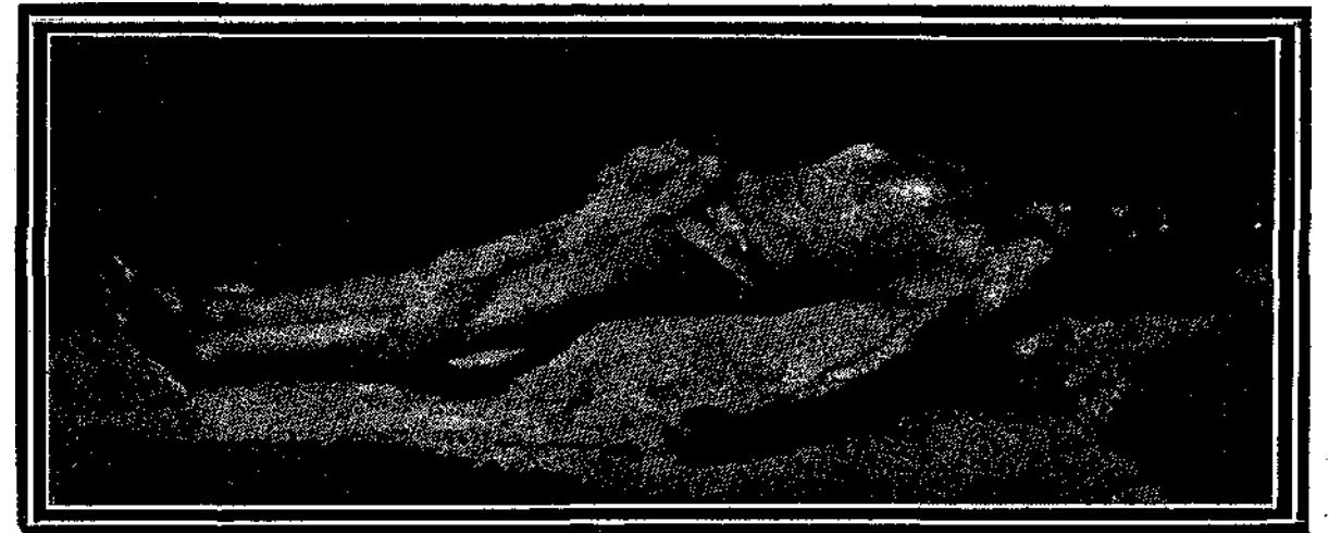
Πίναξ τοῦ Henner

Μόνος ὁ παντέλειος καὶ ἀναμάρτητος Ἰησοῦς, ὅστις εἶχε τὸ θάρρος νὰ ἐρωτήσῃ δημοσίᾳ καὶ αὐτοὺς ἔτι τοὺς μισούντας αὐτὸν «Τίς ἐξ ὑμῶν ἐλέγχει με περὶ ἁμαρτίας;» ἠδύνατο νὰ κηρύξῃ παναληθῶς καὶ τὴν κατὰ τοῦ κόσμου νίκην, καὶ τὸν κατὰ τοῦ πονηροῦ θρίαμβον. Ἐκεῖνος μόνος, ὅστις ἐν τῇ προγνωστικῇ αὐτοῦ δυνάμει ἐβλεπε τὰ μέλλοντα νὰ συμβῶσιν ὡς παρόντα,