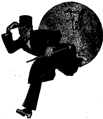
Ἦρχισα νὰ τρέχω....

εἰς τὰς παρόδους, τίποτε. Δὲν ἤξεύρω πῶς ὅρα ἀνεζήτου καὶ ἐπερίμενα. Τέλος ἐπέστρεψα ἀπρακτός.