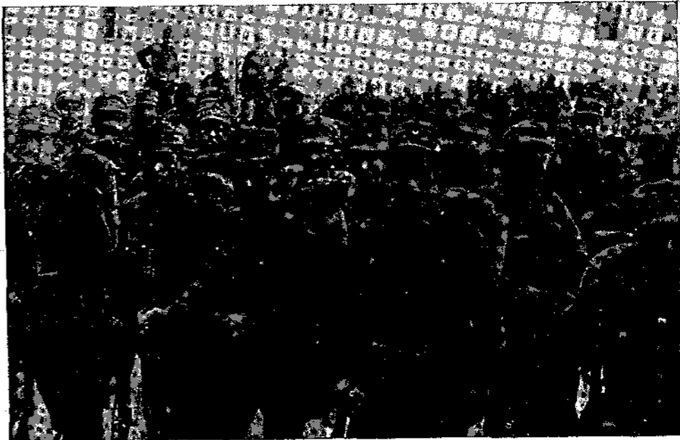
Τὸ γενναίως πολεμήσαν πάντοτε εἰς τὴν γραμμὴν τοῦ πυρός

Σὰς γράφω τὴν προῦσαν μου μὲ πολλὴν οικονομίαν χρόνου, διότι δὲν μᾶς μένει καιρός. Ὡς πρὸς τὴν υγίειν μου καὶ ζωὴν μου μὴ ἀνησυχεῖτε, ὅλονέν εἰσερχόμεθα εἰς τὰ σοβαρότερα. Ἡ τύχη μου ἦτο νὰ γλυτώσω ἀπὸ τὸ στόμα τοῦ χάρου, διότι ἡ τρίτη μάχη ἦτο ἀποφασιστικὴ καὶ ἀλησμόνητος. Αἱ ὀβίδες καὶ αἱ σφαίραι ἐπιπτον πλησίον μας. Οἱ τούρκοι εἶχον ὀχυρωθῆ εἰς ὑψηλοὺς λόφους καὶ βροχώδεις μὲ 28 πυροβόλα, 22 πολυβόλα καὶ 8—9 χιλ. στρατοῦ. Ἡμεῖς δὲ ἀπὸ κάτω μόνον μὲ μίαν πυροβολαρχίαν καὶ τὸ 1ον πεζικόν, μὲ 7ον εἰς τὸ κέντρον καὶ τὰ δεξιὰ καὶ ἀριστερὰ μᾶς ἄλλα 2 συντάγματα. Ἡ μάχη αὐτὴ δὲν περιγράφεται. Ἐκτός ὅπου εἶχομεν ὅλα τὰ μειονεκτήματα καὶ ἐβράδυναν νὰ προσέλθουν αἱ διαταχθεῖσαι δύο πυροβολαρχίαι, εἶχομεν καὶ τὴν βροχὴν καὶ τὸ λασπῶδες μέρος καθ' ἡμῶν. Νὰ