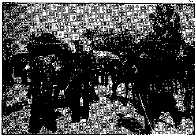
Το Πεζικόν εις τὰ παραπήγματα έτοιμον πρὸς ἀναχώρησιν.