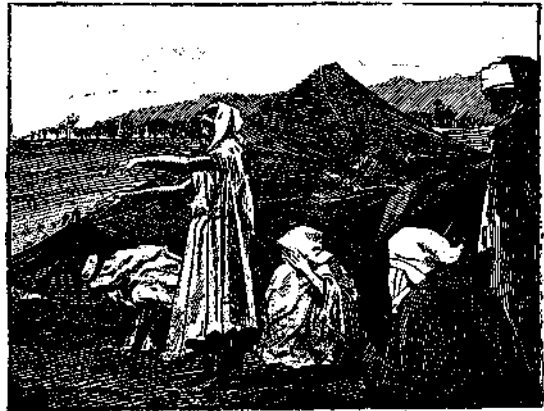
Εἰκ. 5. Τὴν πρωΐαν οἱ Ἄραβες, ἰδίως νομάδες τῆς Ἀλγερίας προσεύχονται γονυπετοῦντες καὶ ὑποκλινόμενοι πρὸς τὸν ἥλιον ἀνατέλλοντα πρὸς τὴν διεύθυνσιν τῆς Μέκκας.

Οἱ ἄνθρωποι λοιπὸν διὰ νὰ κατευθυνθῶσι βοηθοῦνται ὑπὸ τῆς λίαν ἀνεπτυγμένης μνήμης μόνον, ἥτις τοῖς ἐπιτρέπει νὰ ἀναγνω-