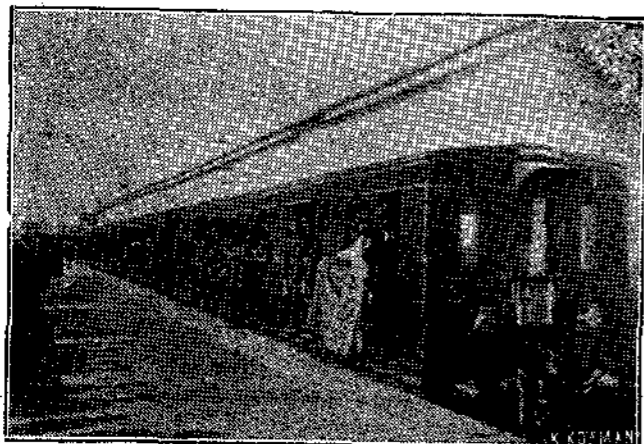
Ἀφίξις τῶν Ἑλλήνων ἐθελοντῶν ἐξ Ἀμερικῆς

Εἰς τὰ χωρία ὅθεν διερχόμεθα οἱ κάτοικοι θαυμάζουν ἀπὸ χαρὰν καὶ δὲν εἰσέρουν τί νὰ μᾶς κάμουν, διὰ νὰ μᾶς εὐχαριστήσουν.