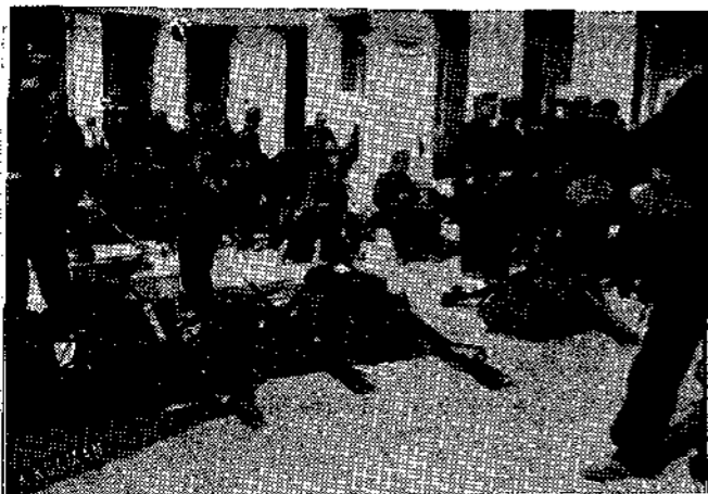
Συγκέντρωσις μετά την Μάχην.