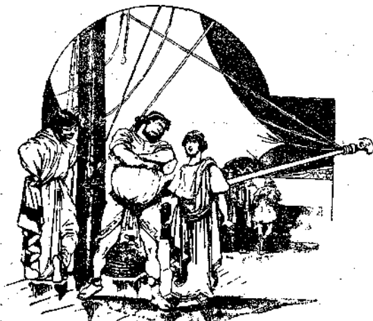
Μυρμιδῶν ὅπου εἶσαι.....

Ἐν τούτοις μετέβη εἰς τὸν οἶκον τοῦ Πολύφρονος διὰ νὰ τοῦ δηλώσῃ, ὅτι ἐπιθυμεῖ νὰ