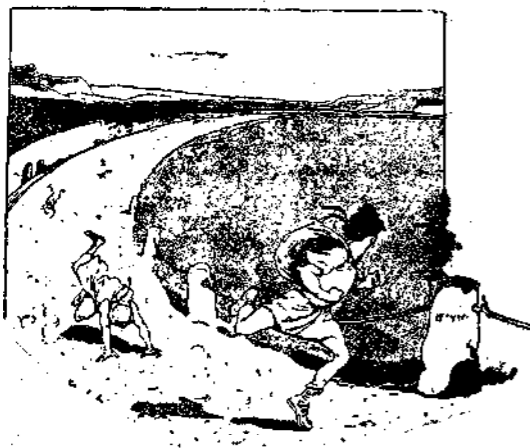
Οἱ δομοεῖς ὀλισθαίνουν καὶ ἐπιπτουν

Μετέβη λοιπὸν ὁ Κριτόβουλος εἰς τὸν ναὸν τοῦ Ἀπόλλωνος διὰ νὰ προσφέρῃ τὸν κρατῆρα του, ἀφοῦ προηγουμένως ἐλούσθη εἰς τὴν πηγὴν τῆς Κασταλίας. Ἐστεφανωμένος ἔπειτα διὰ δάφνης, διήλθε πρὸ τῶν 4,000 ἀγαλμάτων