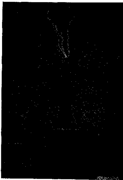
Κεραυνὸς ἐπὶ τοῦ πύργου "Αἶφελ

Παρατηρήσατε, δπόταν ἀστραπὴ τις ἐκρηγνύται καὶ φωτίζῃ κινουμένον τι ἀντικείμενον, ὅλον μίαν ἀτμομηχανὴν κινουμένην ἐν μεγάλῃ