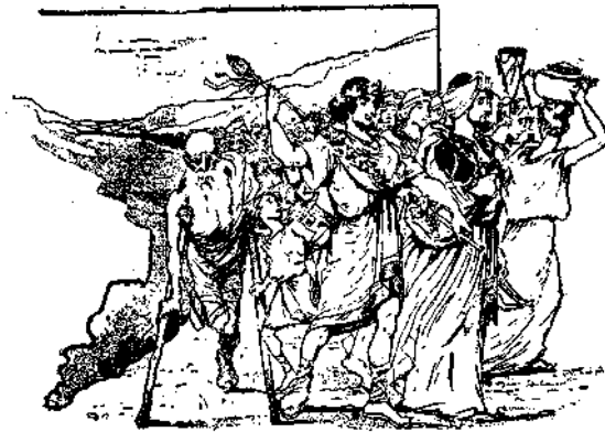
Πομπαι διέσχισον τὴν πεδιάδα...

Ἀπὸ τὴν ἡμέραν δὲ τοῦ ἐπεισοδίου αὐτοῦ οἱ κωπηλάται ἔπαυσαν νὰ εἶνε μὲ τὸ μέρος τοῦ Μίλωνος. Ὅταν ἔφθασαν εἰς τὸν ὄρμον τῶν Κυρῶν, εὗρον τοὺς στόλους ὄλων τῶν Ἑλληνικῶν πόλεων ὡς καὶ πολλὰς προετοιμασίας διὰ τὴν ἐορτήν. Οἱ προσκυνηταὶ ἐβάδιζον κατὰ μῆκος τοῦ Πλειστοῦ ποταμοῦ, παρὰ τὸν ὅποιον ἐξετείνετο τὸ ἵπποδρόμιον. Εἰς τὸ βάθος ἐφαίνετο ὁ Παρνασσὸς καὶ ἐπὶ τῶν πλευρῶν τοῦ ὄρους οἱ Δελφοὶ, μὲ τὰς σειρὰς τῶν οἰκιῶν καὶ τὸν περίχρυσον ναόν.