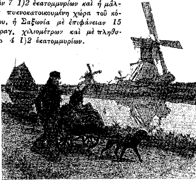
Ἀπὸ τὰ ποιητικὰ τοπεῖα τῆς ὀρειᾶς Ὀλλανδίας.

Ἡ παραγωγή τῶν δημητριακῶν ἐν Ὀλλανδίᾳ ἐλαττοῦται διαρκῶς ἐν τῷ συνόλῳ, μολονότι ἡ καθ' ἑκτάριον ἀπόδοσις αὐξάνει. Ὁ λόγος ἀπλούστατος.