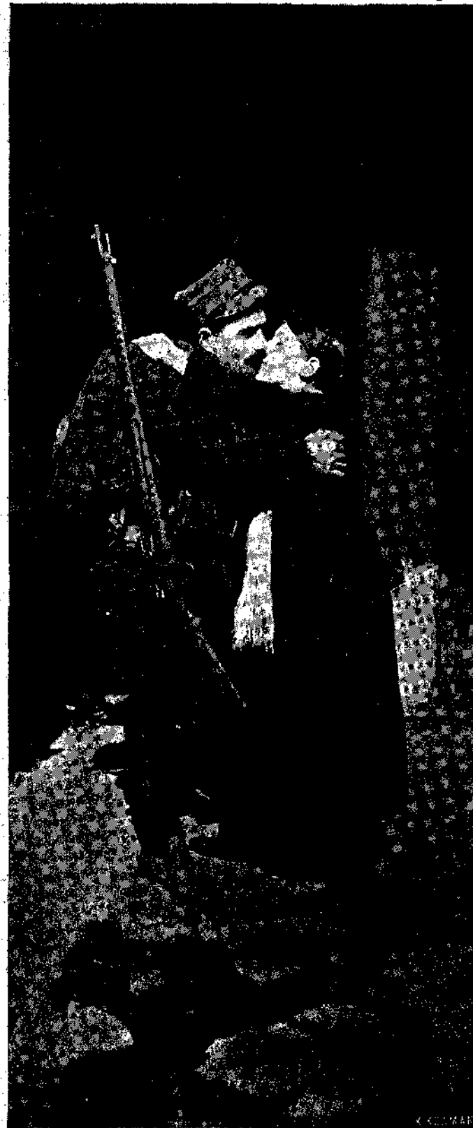
ΜΕΤΑ ΤΗΝ ΕΠΙΛΟΓΟΝ