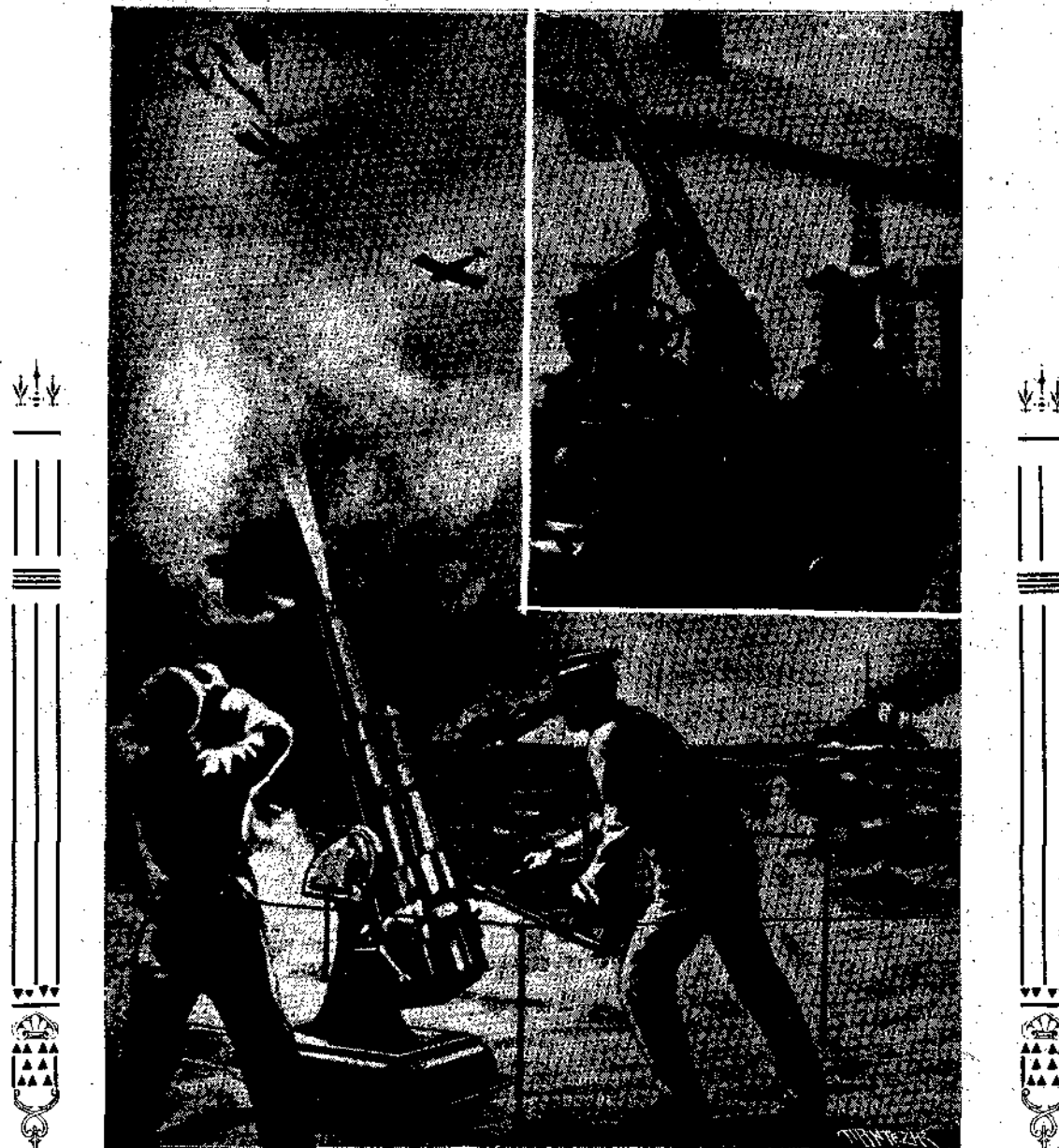
ΚΑΤΑ ΤΩΝ ΑΕΡΟΠΛΑΝΩΝ

Βεβαίως ὁ ἴδιότης τῆς ἀληθοῦς χημείας θεωρεῖται ὁ Lavoisier. Ἀλλὰ καὶ αἱ ἐπιστήμαι ἔχουσι τοὺς νηπιώδεις χρόνους. Αἱ φιλοσοφικαὶ διάνοιαι τῶν Ἰνδῶν καὶ Ἑλλήνων, ἂν καὶ μεγάλαι, δὲν ἠδυνήθησαν νὰ φθάσουν εἰς τὴν σημερινὴν ἔννοιαν τῆς χημείας. Ἐπιβόλαιαι γνώσεις, ἐμπειρικαὶ καὶ πρακτικαὶ ἀπέπειροι, σύγχυσις περὶ τῆς χημικῆς συνθέσεως. Τὰ τέσσαρα στοιχεῖα πῦρ, ὕδωρ, ἀήρ καὶ γῆ τῶν