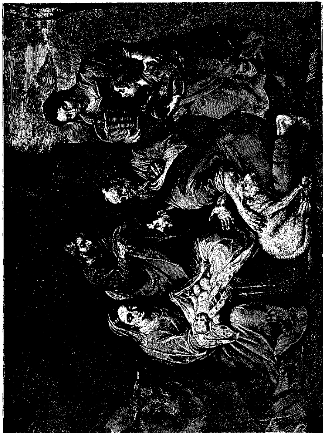
ΤΟ ΠΡΟΣΚΥΝΗΜΑ ΤΟΥ ΙΗΣΟΥ