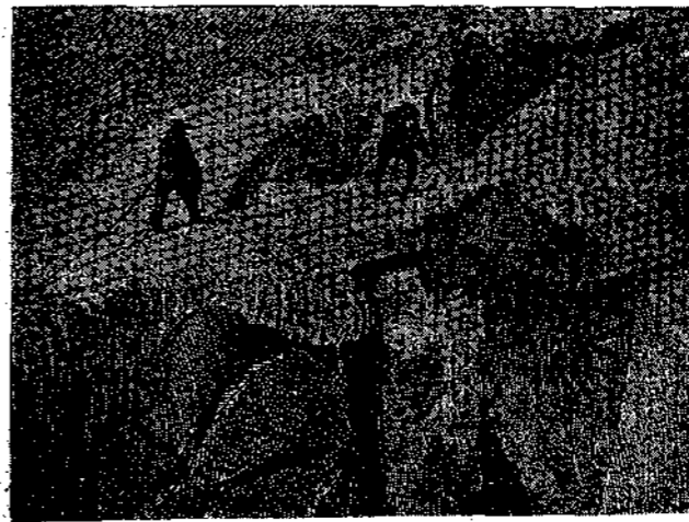
Διάβασις χιονοπλέκτου γεφύρας. Ὁ ὁδηγὸς προπαρασκευάζει μετὰ προσοχῆς διὰ τῆς σκαπάνης τοῦ τὴν ἀντοχὴν τοῦ πάγου.

σεις τῆς φωνῆς δύναται νὰ μετακινήσῃ τὴν πελώρια τεμάχια πάγου καὶ νὰ σᾶς καταπλακώσωσι. «Πρέπει νὰ δοκιμάσῃτε καὶ τοῦτο, λέγει ὁ Τυνδάλ, διὰ τὴν βεβαιωθῆτε, ὅτι ὁ ἥχος τῆς