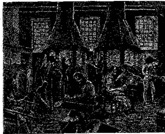
Εικ. 5η. Οι κλιβανοί τῆς κυπελλοποιΐας

Ο κυλινδρος θερμαίνεται επείτα εσωτερικῶς διά πεπυρακτωμένης σιδηράς ράβδου,