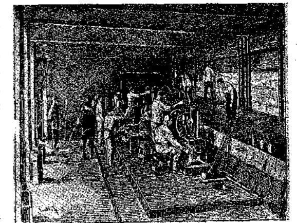
Εικ. 6η. Κατασκευὴ τών φιαλῶν κατά τό νέον σύστημα.

Σήμερα η ύαλουργική βιομηχανία έχει προοδεύσει εις μέγιστον βαθμόν και οι δυστυχεΐς εργάται τῆς ύάλου χάρις εις τὰς προόδους τών μηχανημάτων, τὰς τελειοποιήσεις τών εργο-