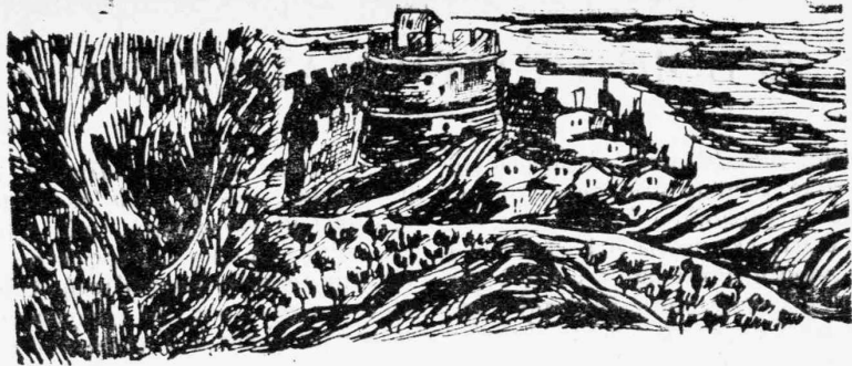
ΑΠΟ Τ' ΑΡΙΣΤΟΥΡΓΗΜΑΤΑ ΤΟΥ ΛΑΟΥ ΜΑΣ

Δεν είναι δὲ καθόλου παράδοξο το ότι δεν μελετήθηκε σοβαρά το σφρονιστικό πρόβλημα σε μās, αφού και τόσα άλλα κοινωνικά προβλήματα είχαν την αυτή τύχη και αυτό γιατί μās λείπει η κοινωνιστική νοοτροπία. "Ας έλπίσουμε ότι όταν θά έλθῆ η ποθητή ειρήνη μέσα στα τόσα άλλα κοινωνικά προβλήματα δεν θά ξεχασθῆ και το σφρονιστικό και το της εγκληματικότητας ζήτημα, που μπορεί να λυθῆ πιο εύκολα σε μās από άλλα κράτη, γιατί στα αλήθεια δεν έχουμε πραγματική εγκληματικότητα, αλλά περισσότερο κοινωνική άθλιότητα και ότι η σφρονιστική προσπάθεια ιδιαίτερα σε μās θά πραγματοποιήση το ιδανικό, που βρίσκουμε στα λόγια του Πλάτωνος: «σφρονίζει γάρ που και δικαιότερους ποιεί Ιατρική γίνεται πονηρίας ή δίκη».