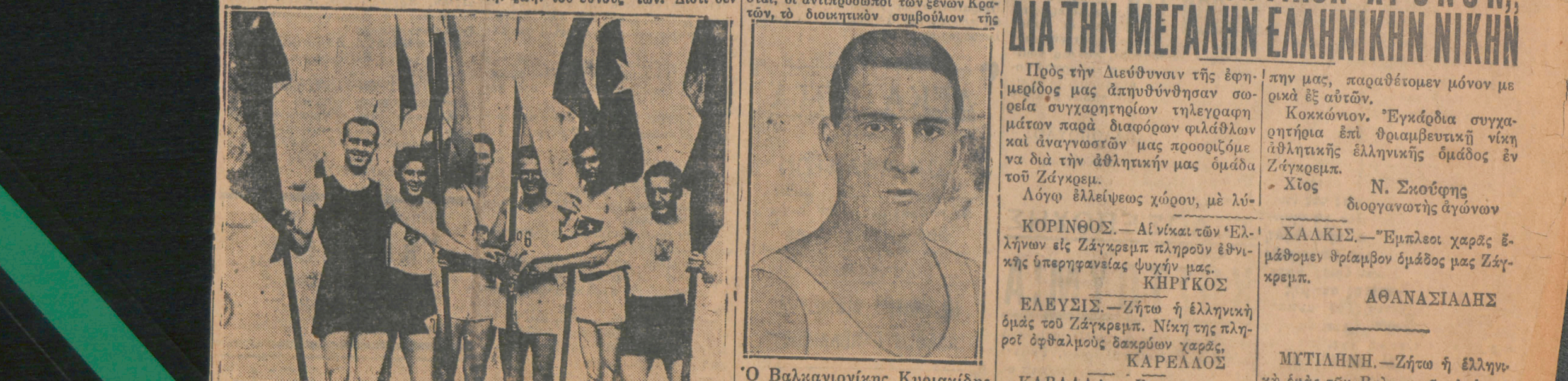
Οι οπιασοδοροι των συμμετεχόντων εις τούς Βαλκανικούς άγώνας Κρατών.

Απαιτούμεν ότι έκπληρώσμε τα μάλλα εκ της διαφανείσ ακέψους, τού να άφαιρέσθ από την 'Ελληνικήν όμάς αι νίκαι και οι πολυτιμοί αμοι, τούς όποιους με τίμιο άγώνα εις τόν στίβον ενόπιον Θεού και άνθρώπων, άπεκίησμεν, χάρις εις την εζοχρϊκότητα τού θρηλικού Κεΐριου άθλητού.