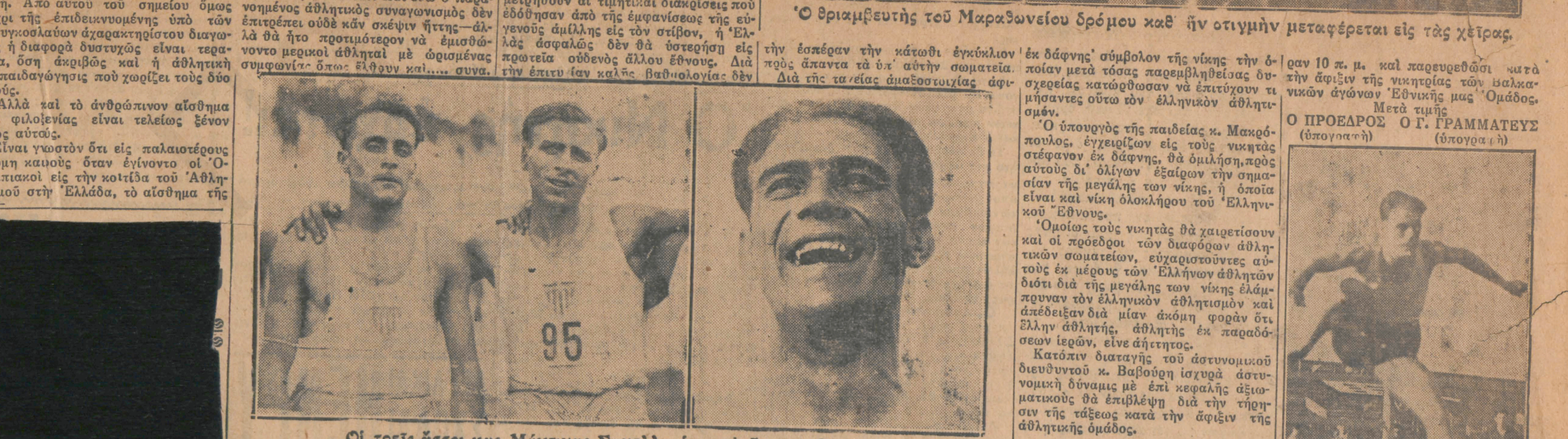
Ο Έλληνας ΤΡΑΥΛΟΣ δεύτερος νικητής του έλματος εις μήκος

Ο έλληνας αθλητισμός ό όποιος εύδως ώς διετυπώθη και ή παραμικρά κατηγορία διά την ειλικρινή νίκη ενός εκ των διακονούτων παρ' αυτό, έπεσαν εν άκυρόση τόν άνω άκρως εκ της σαρκής της τεθιμένως να δεχθή και συνζητήσιον καν διά την τάση των και άναμνησθήτο νί- Μαοιλαοί τον άνοητα εν τω έλεος ήτοι μέσσω άκτανωθήτου απαλαμτατικής έπαυμιας, άπεμολεΐτο, τό έλληνικόν δικαίον και οι Έλληνες έδεχόμεθα άδύμαρτηρώτωσ κολάωμω. Η συνερσασία και ή φιλία των λαών δέν εδράζεται εις τάς συνθήκας και τό σύμφωνα, τά όποια εις την αντίθετον ριπήν τού άνεμου καταπίπτου ώς χάρτινος πύργος. Σηριζείται όμως εις την όμοιοζίαν κατα νόημα την έμπιστοσύνην και την ψυχικην έπαρην των Βαλκανικών λαών, άναλωμας των όποιων έν τώ συνόλω των πηγνυται ή γενική εδμμερία και πρόδοξ.