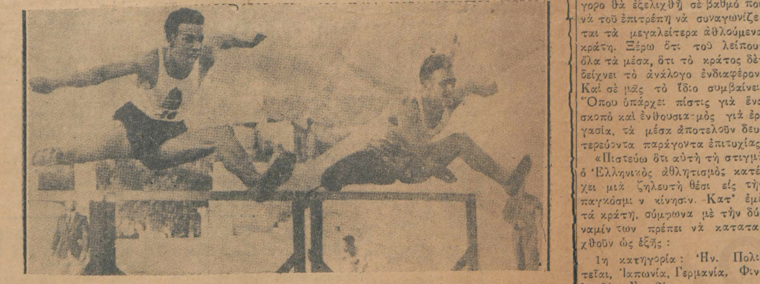
Ἐκ τῆς συνέντευξης με τοὺς ἀναχωρήσαντας Ουγγροὺς ἀθλητᾶς...

ΜΑΚΡΑ ΣΥΝΕΝΤΕΥΞΙΣ ΜΕ ΤΟΥΣ ΑΝΑΧΩΡΗΣΑΝΤΑΣ ΟΥΓΓΡΟΥΣ ΑΘΛΗΤΑΣ