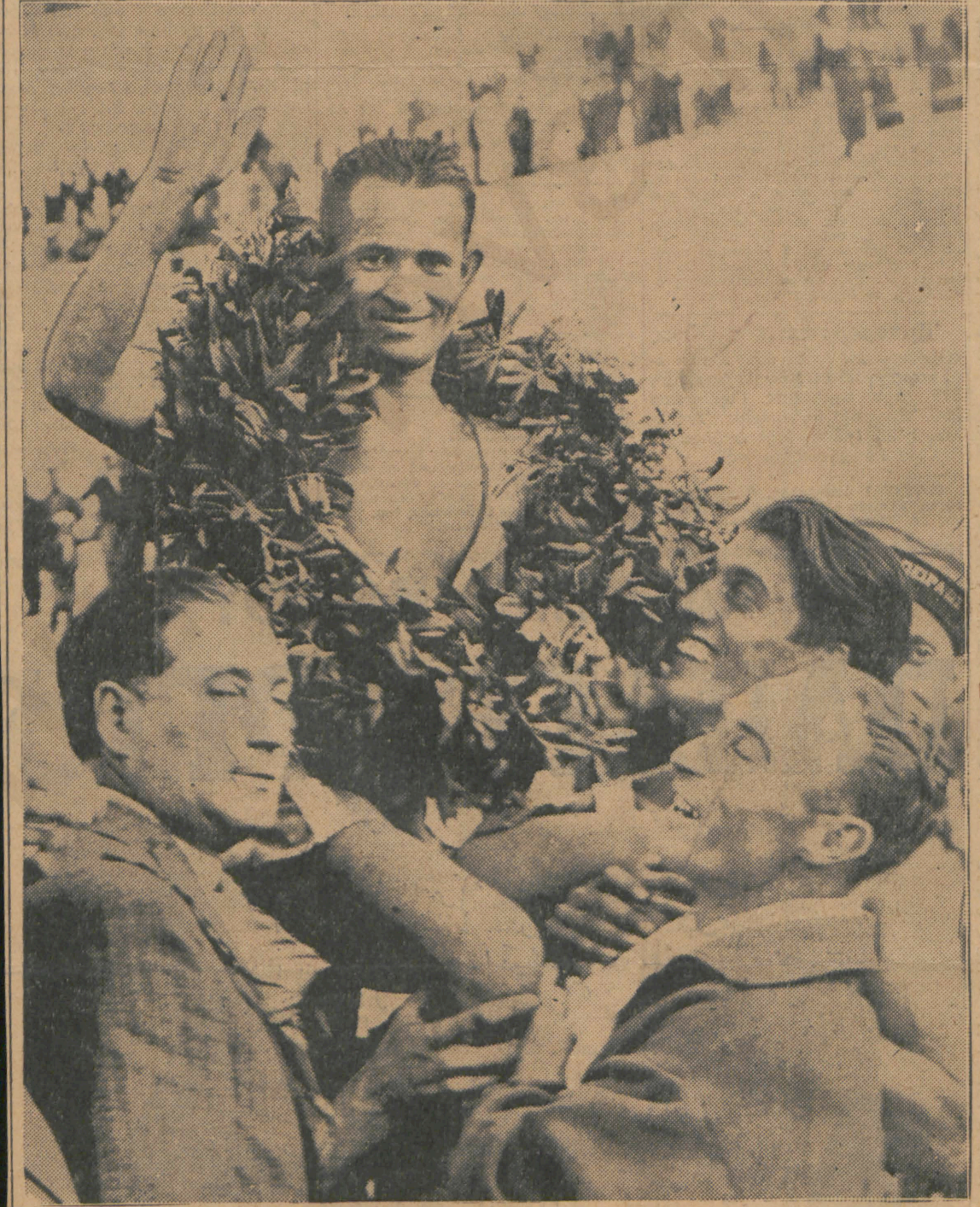
Οἱ Ρουμάνοι ἀθληταὶ τοῦ δεκάθλου καὶ οἱ ἀρχηγοὶ τῆς ομάδος των φέρουν θριαμβευτικὰ στὰ χεῖρά τὸν νικητὴν τοῦ Μαραθωνίου Γκάλ, δαφνοστεφανωμένον

μένην καὶ φθάνει σὺν βοῇ στοὺς Στάδιον. — Ἐρχεται... Ἐρχεται... Ὅλοι τώρα καρφώνουν μετὰ γωνία τὰ βλέμματά τους στοὺς ἐντός τοῦ στίβου. Μ' αὐτοὺς με-