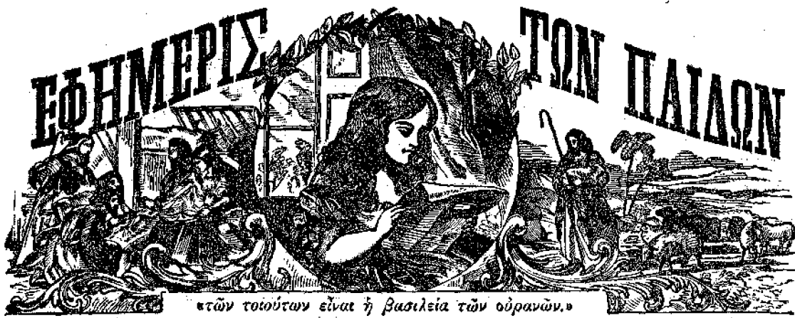
«τῶν τοιούτων εἶναι ἡ βασιλεία τῶν οὐρανῶν.»