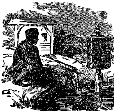
ΠΩΣ ΠΡΟΣΕΥΧΟΝΤΑΙ ΟΙ ΕΙΔΩΛΟΛΑΤΡΑΙ.

12) Ὅλη ἡ ζωὴ σου εἰς κυβερνᾶται ἀπὸ ἑνα καὶ μόνον σκοπὸν· νὰ δοξάσῃς δηλαδὴ τὸν Θεὸν ἐπὶ τῆς γῆς, καὶ νὰ προετοιμασθῇς νὰ τὸν ὑπηρετῇς αἰωνίως· εἰς τοὺς οὐρανοὺς.