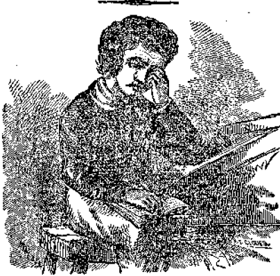
ΑΠΟΤΕΛΕΣΜΑΤΑ ΠΡΩΨΟΥ ΣΠΟΥΔΗΣ.

5) Ὅταν ἦσαι ὄργισμένος, μὴ ὀμῶναι πρὶν μετρήσης δέκα.