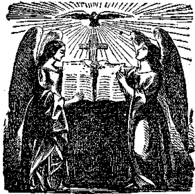
Ἡ Ἁγία Γραφή.

Μικροὶ μου, φίλοι, ὁσάντις βλέπετε τὸ κόκκινον χρῶμα, τὸ ὅποιον τὰ μικρὰ παιδιὰ τόσον πολὺ ἀγαποῦν, μὴ λησμονήτε ὅτι ὁ Θεὸς τὸ ἔχαμεν ἐπίτηδες πρὸς εὐχαρίστησιν σας, καὶ ἀγαπᾶτε καὶ ὑπακούετε Ἰὸν πάντα.