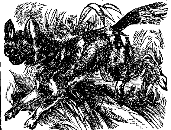
ἄγριος Κυνηγετικὸς κύων.

Τὸ γένος τῶν κυνῶν περιλαμβάνει τέσσαρα ἐξωρι- στά εἶδη· τὸ τῶν καθ' αὐτὸ σκύλων, τὸ τῶν λύκων, τὸ τῶν θωῶν (σακαλιῶν) καὶ τὸ τῶν ἀλωπέκων. Τὸ εἶδος τῶν σκύλων εἶναι τὸ σημαντικώτατον διὰ τὸν ἄνθρω- πον καὶ περὶ τούτου θέλομεν εἰπεῖ ὀλίγα πρὸς διδα- σκαλίαν τῶν μικρῶν ἀναγνώστων μας. Τὸ εἶδος τῶν σκύλων ἀποτελεῖται ἐκ τῶν ἀγρίων καὶ τῶν ἡ-